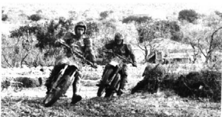
Espléndida colección de fotos de Serafín Mestre tomadas durante el espectacular circuito de moto-cross que tuvo lugar el pasado día 13 de enero.