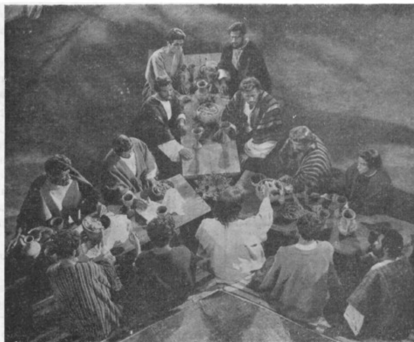
Film espectacular: una escena de «Rey de reyes»

Todas las formas técnicas están muy rebuscadas y a veces son puros