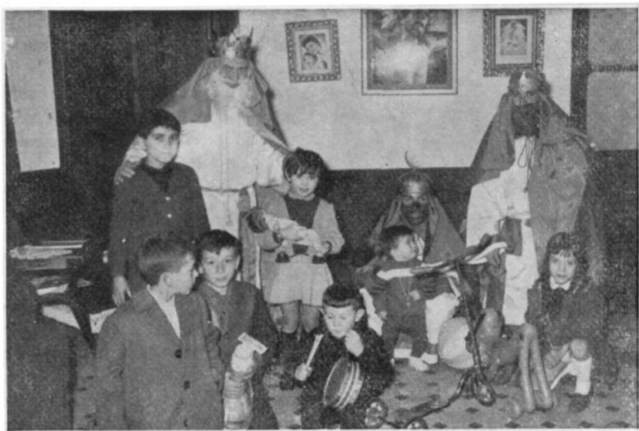
Unos niños reciben de Sus Majestades los Reyes Magos, los juguetes que según su comportamiento, se habían hecho acreedores. (Foto Torres).