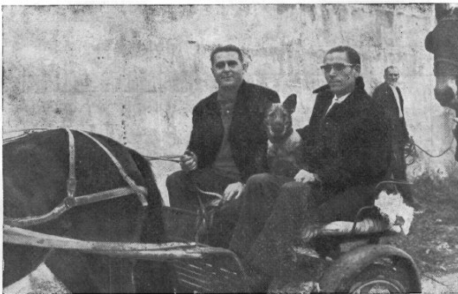
También los perros hicieron "acto de presencia" en el momento culminante de la cabalgata. Este que reproducimos en la presente parece que su atención está fijada solamente en resultar "fotogénico"..