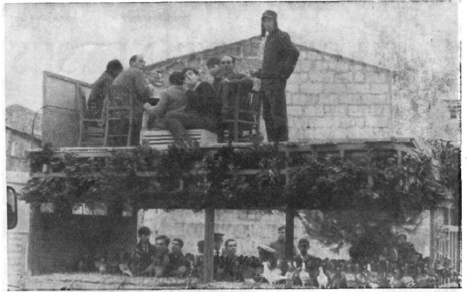
En esta fotografía, pueden observar la carroza de la Sociedad Colombófila Mensajera local, que al final de la cabalgata soltó, en espectacular momento, más de 700 palomos.

Con el objeto de vivir unos ratos con sus familiares y amistades, recordando tiempos transcurridos anteriormente en Artá, han visitado nues-