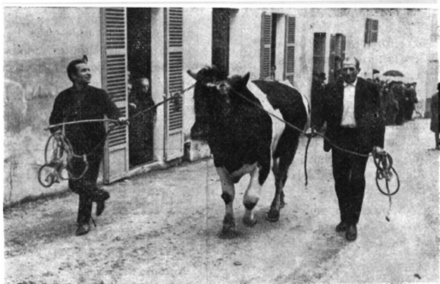
Aquí queda bien demostrado como la clásica "beneida", fue motivo para la exhibición de varias especies de animales. Este hermoso bovino causó magnífica admiración entre el numeroso público. (Foto Torres).

Desde principio de año y mientras no esté en condiciones para su puesta en funcionamiento el recientemente coche fúnebre para nuestra localidad se ha prestado en servirnos en todos los casos de necesidad el de nuestro vecino pueblo de Son Servera.