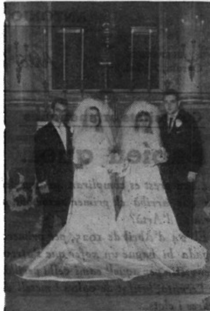
Enlaces: Gili-González y Alzamora-Gili