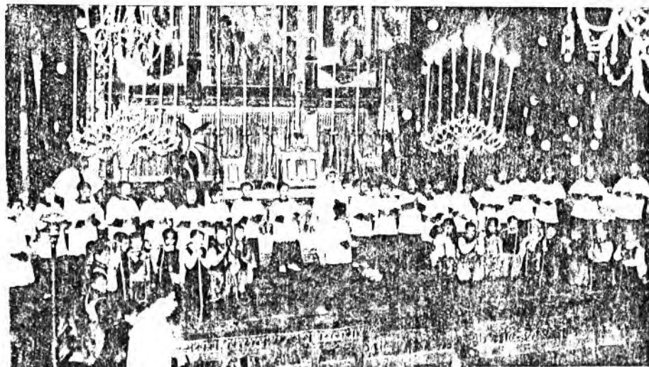
En la Parroquia, los pastores y la Escolanía han adorado al Niño Jesús.