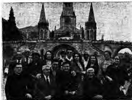
Nuestros excursionistas, en Lourdes.

Misa en la iglesia que los Jesuitas tienen en la calle de Lauria, a la que asistimos y comulgamos todos. Después visitamos la Exposición, muy digna de verse, ya que este año había más representaciones de naciones extranjeras que en años anteriores. La visita al Tibidabo también nos resultó extremadamente grata, lo mismo que la que hicimos a la Sagrada Familia y al Parque Zoológico. Al anochecer pernoctamos en Montserrat en donde asistimos a los actos del Santuario, visitando todo lo de allá al día siguiente, rebosando todo lo del Monasterio de un indudable interés religioso y turístico. En Montserrat se agregaron a nuestra expedición 12 catalanes que iban también a Lourdes; unos eran del pueblo de Avinyó y los otros de Sta. Maria de l'Estany, acompañados de su Sr. Ecónomo, más una "señorita" de Manresa, muy simpática, como lo eran