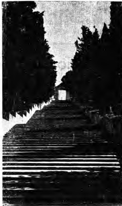
L'escala de Sant Salvador amb els seus magnífics xiprers