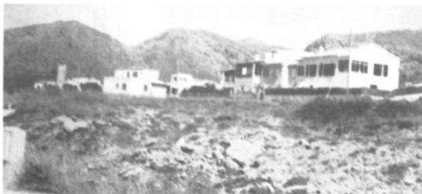
Vista de la Colonia y las montañas que la rodean.

Desde el anterior número de Septiembre el ambiente de la Colonia ha cambiado visiblemente, ya que al empezar las clases los menores y los trabajos de los mayores, se acusa mucho el descenso de personal en este tranquilo rincón, si bien este año, por la tardanza en llegar las lluvias, se retrasó en algunos la fecha de retorno a sus lugares de residencia fija, puesto que el calor fue bastante fuerte hasta finales de Septiembre, y esto hacía más apetecible la brisa del mar.