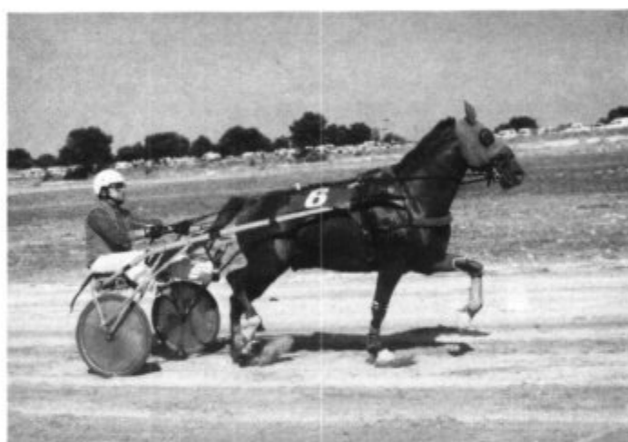
RIGGI, ganador del PREMIO CRITERIUM 2 AÑOS.

Cuando el caballo MALTEMPS VX de Sa Corbaia, atravesaba un buen momento, del cual se había clasificado en sus cinco últimas carreras, ha tenido un accidente con un coche, de cuya lesión, tendrá que estar apartado de las competiciones durante una temporada.