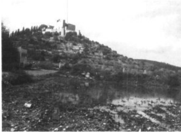
Aspecto de los campos artanenses inundados.