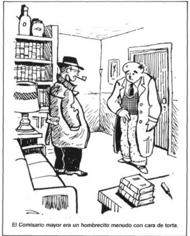
El Comisario mayor era un hombrequito menudo con cara de torta.

—Siento contradecirle, pero cuando Mauricio encontró sin vida a don Silvio lo primero que hizo fue avisar a la policía, olvidándose de sus quehaceres domésticos. En cuanto al viejo, puedo asegurarle que nunca puso sus manos en un lavadero, era algo por lo que sentía verdadera fobia, prefería no tomar café o té antes de lavar un plato, un vaso, o una taza.