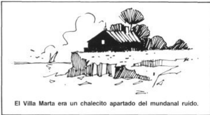
El Villa Marta era un chalecito apartado del mundanal ruido.

El cuerpo sin vida del profesor Silvio fue encontrado por la policía en su cuarto de trabajo, estaba sentado en su escritorio con el bolígrafo entre los dedos de su mano derecha, mientras que con la izquierda sujetaba el bloc donde solía tomar apuntes. Aparentaba muerte natural, sin embargo varios detalles a simple vista sin importancia revelaron al comisario Castell que se trataba de un crimen.