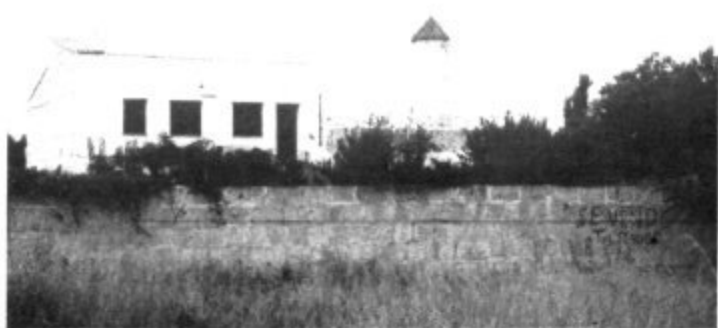
Testigo de la Colonia en otros tiempos.

Reyes Magos. —Vistosa fue la cabalgata de vísperas de Reyes Magos, que cabalgaron desde el punto de desembarque a la Parroquia, en donde asistieron a la consabida Misa, terminada la cual pasaron al local del Centro Cultural, en cuyo teatro procedieron