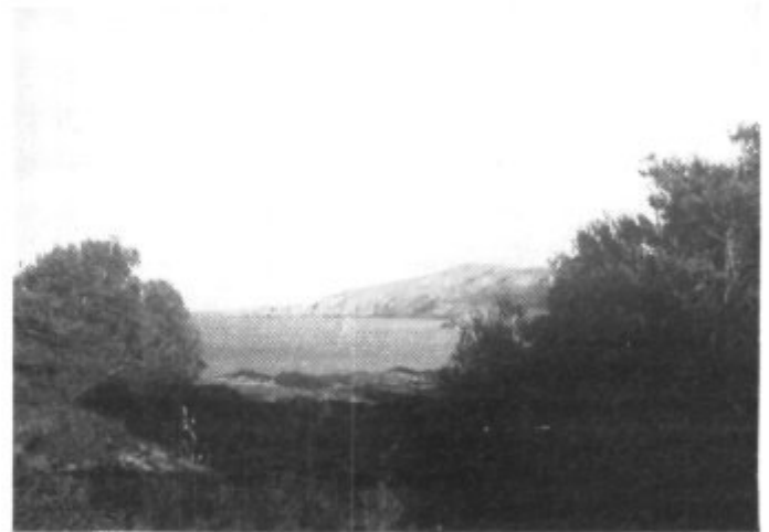
Aquella mar blava que comença en Es Saulonar.

Un quilo de mel té el mateix valor nutritiu que vint-i-cinc plàtans, cinquanta ous, un quilo i mig de carn de vaca o una peça de formatge de sis-cents grams. Com veis, hi ha-