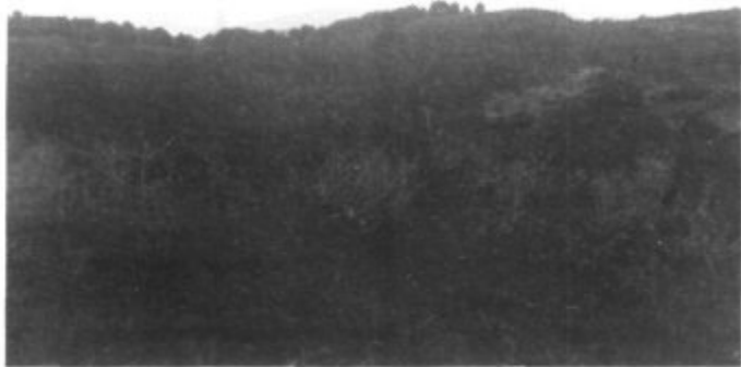
S'Arboceret i molt al fons Sa Talaia Freda.

via moltes de raons perquè la comunitat d'Ermitans cuidàs les caseres i tingués permanentment un ermità de sa mel o beieroler. Aquest, havia d'esser un home fort, ben constituït, caminador incansable i sense por a qui alena.