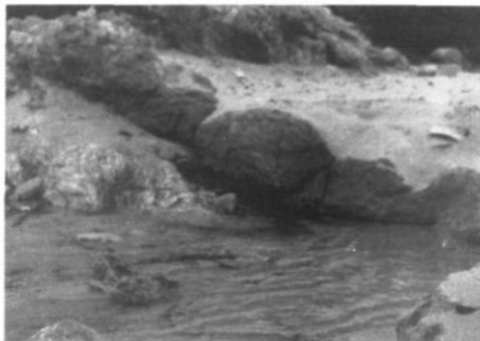
Font Celada rajant damunt la platja.