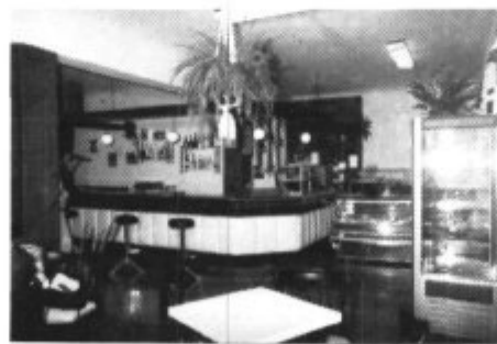
Que be ha quedada sa xocolateria i gelateria ALMUDAINA.