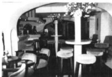
Trui está a s'altura de qualsevol pup europeu.