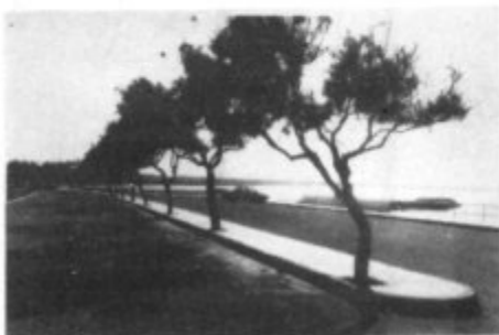
Ca Los Cans

Hace aproximadamente un año, un asiduo colaborador de esta revista y yo mismo, denunciábamos el triste y deteriorado aspecto que ofrecía la Cala de Ca Los Cans, por la instalación masiva de tiendas de campaña cuyos moradores, en su gran mayoría, convirtieron este lugar en un basurero.