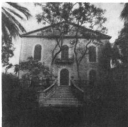
Entrada a Na Batlessa.