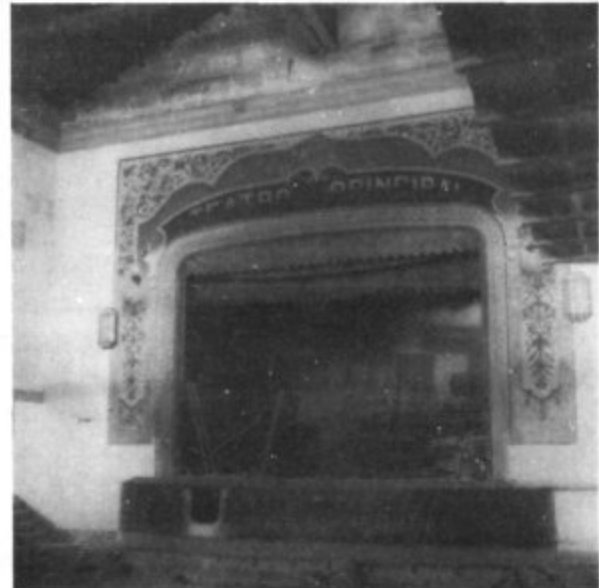
Escenari del Teatre Principal d'Artà.