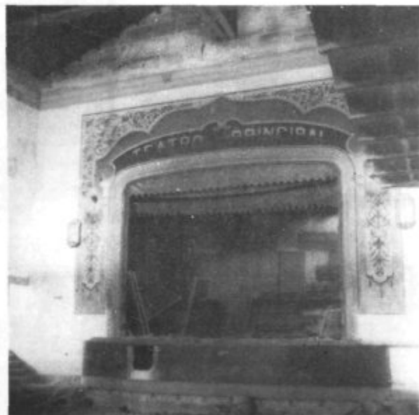
Escenari del Teatre Principal d'Artà.