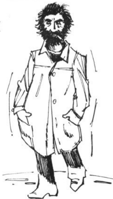
No tots són així...