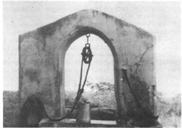
CONTROL SANITARIO DEL AGUA DE BEBIDA

e) Las unidades de captación del agua estarán protegidas de posibles contaminaciones.