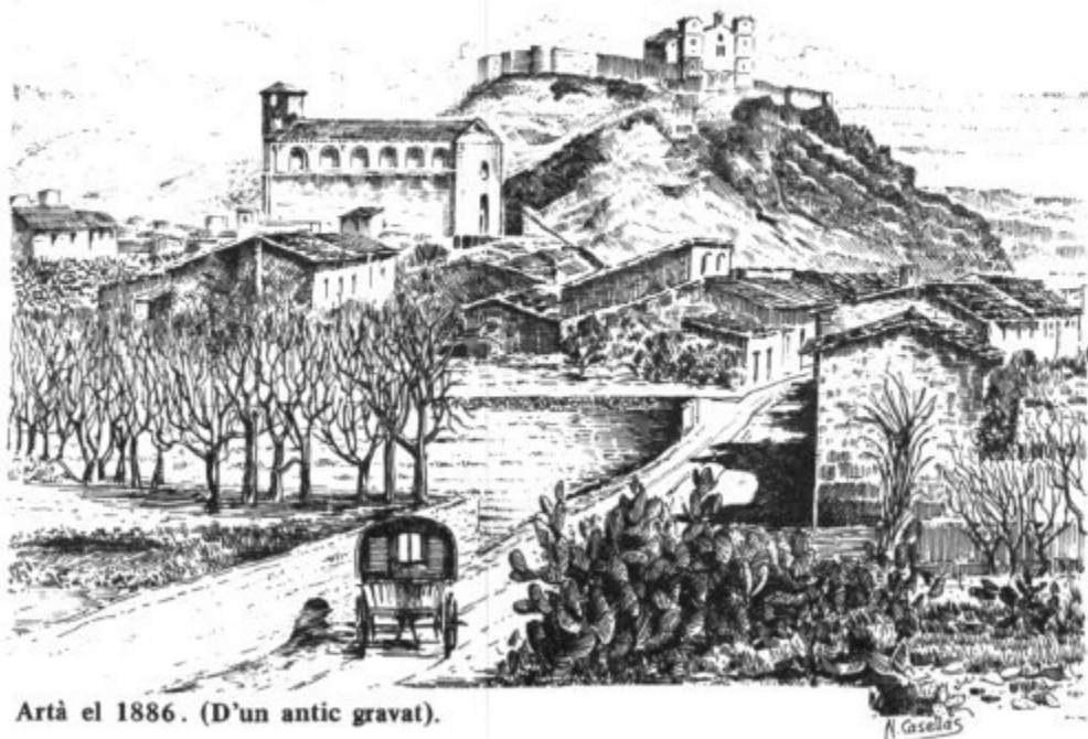
Artà el 1886. (D'un antic gravat).

Parodiant el versicle 7.14 de l'evangeli de Sant Mateu, s'assignà al poble la llegenda "Artà via est qua ducit ad vitam", que figura a l'escut.