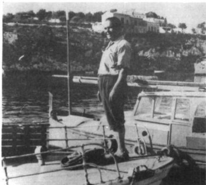
Anys després en Mateu Confit, contempla Es Port de Manacor a bord d'una barca com aquella...

Encara no feia unes hores que havien abandonat, quan a sa seva dona li vengueren es dolors de part Viva el món quin sarau!