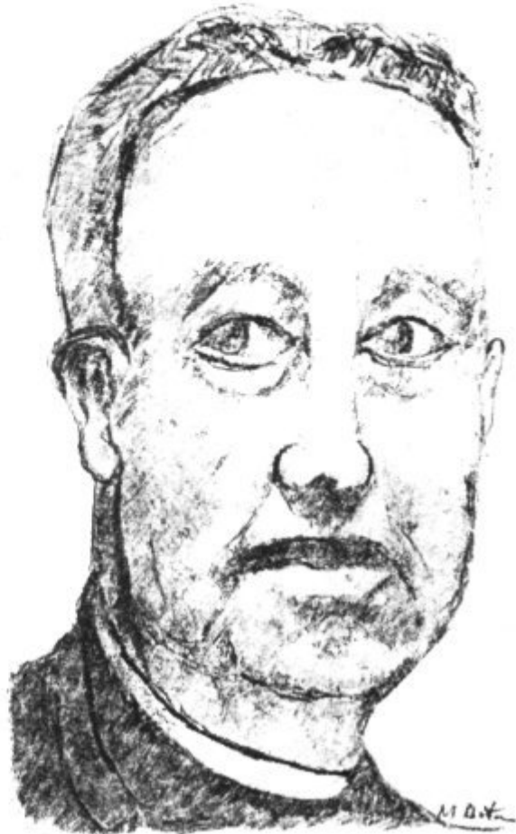
El poeta Miguel Costa i Llobera

Aquesta força irreductible que ni l'ergástul, ni l'esclavitud, ni el domini de tota potència desintegrant mai no la podran enderrocar, el nostre poeta l'inclou dins la senzillesa invulnerable d'un brot de romaní, llavor d'horit-