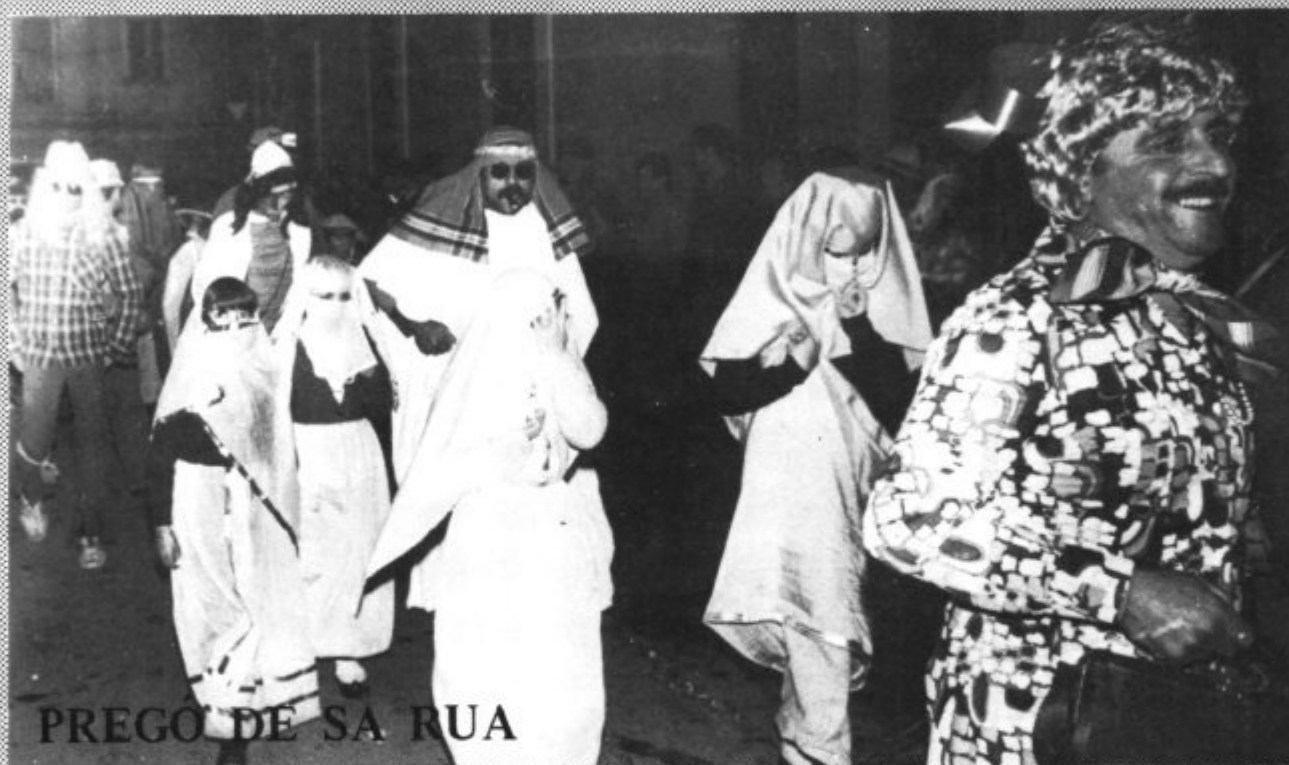
PREGÓ DE SA RUA

A tots els confreres de la Broma, del Tiberi, del Renou, de la Teca i de la Baldufa, i al poble en general, feim a saber: