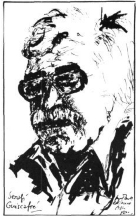
Dibuix de l'autor.

El joc governa i domina totes les races del món. ¿I quin home no es confon quan no sap per on camina? Una rosa i una espina configuren el procés vital i la lluita adés per deixar un gràvid missatge; perquè és el joc del coratge allò que mou el progrés.