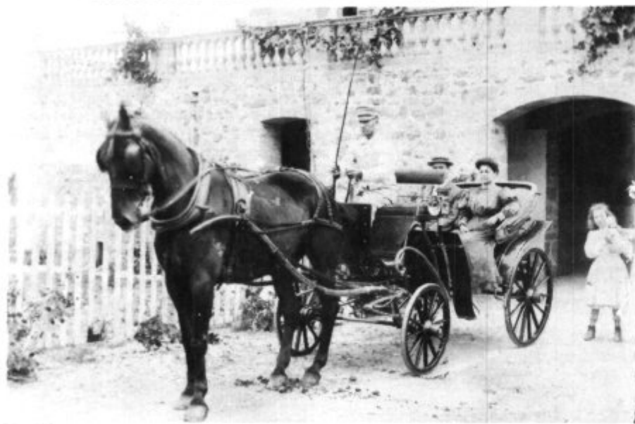
Por fin van a ser acometidas las obras en Na Batlessa. En la foto un detalle de la casa casi recién construida. Casa que, a pesar de su escaso valor arquitectónico puede ser de gran utilidad para el pueblo de Artá.

Nada nos podía alegrar más que dar esta noticia.