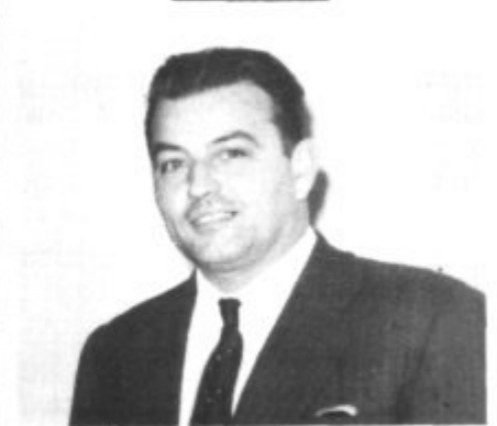
ANTONI LLITERAS NEBOT

67 anys d'edat que morí el 29 de Novembre de 1983 a Artà