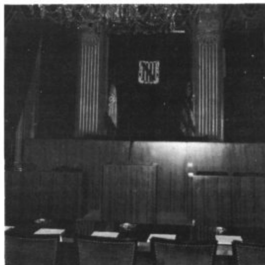
La Taula de Presidència del Parlament.

Y no faltó junto a la puerta, al salir, el detalle final: llevamos todos en la mano un bolígrafo con la inscripción "Parlamento Balear", que podemos conservar para mostrar a las generaciones futuras, que sabrán que vimos nacer la Autonomía y renacer el Círculo Mallorquín, ahora sede de nuestro Parlamento.