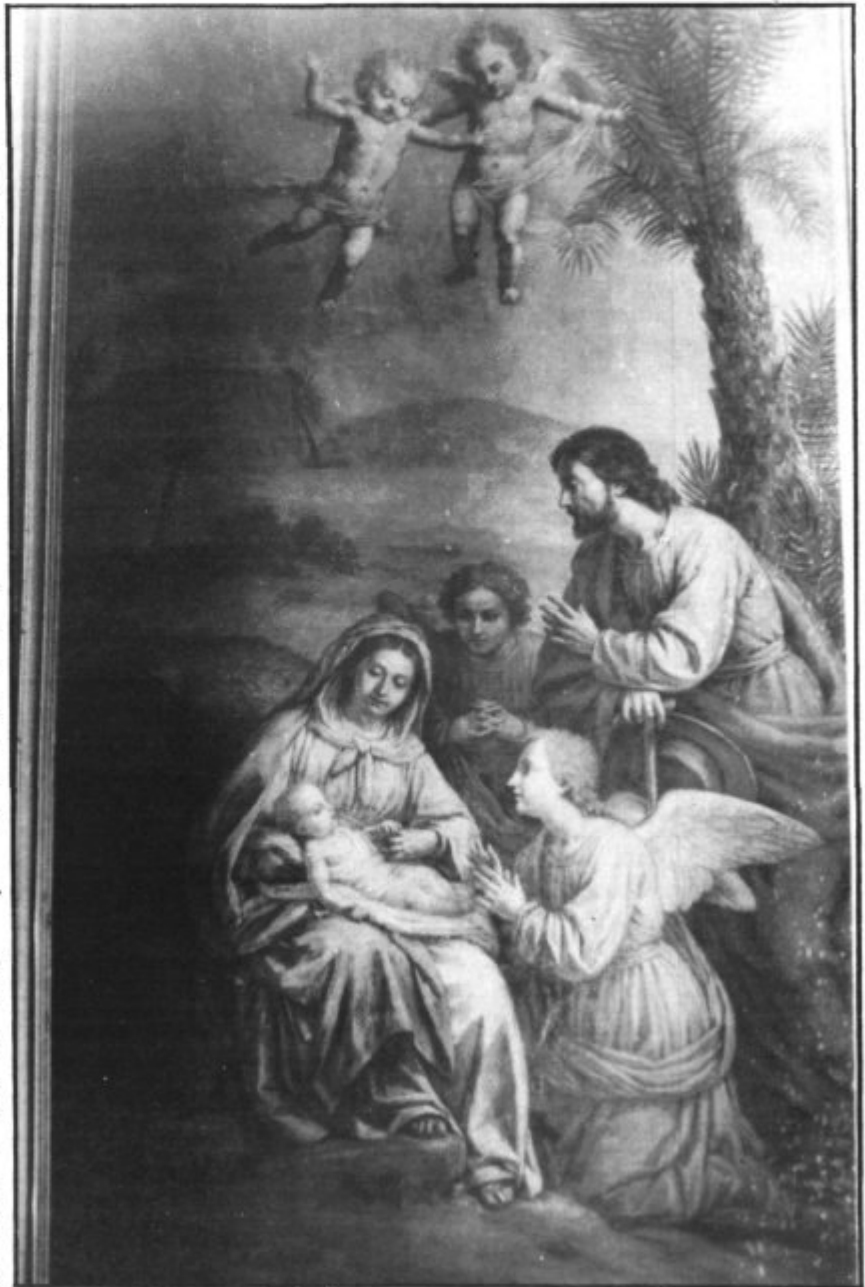
Quadre de Sant Salvador.

A tots vosaltres, bones festes i una sembra de roses per a la vida nova; per continuar junts la tasca deliciosa de conèixer i servir aquest poble que ja estimam amb tota preferència.