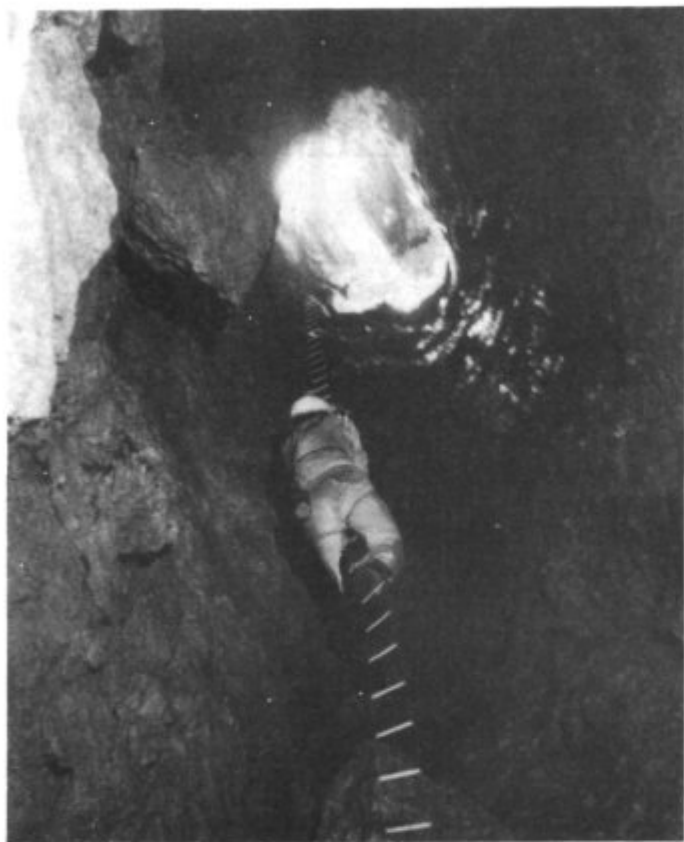
Baixant a N'Es Trevessets

—I, de què anau per aquí? —Venim a topografiar s'avenc d'es Travessets. —Ja ho feren uns catalans. —Has vist es gràfic tú. —No, jo no. —Ni noltros tampoc. Així que mos n'anam cap allà. Muntarem es campament i, a cosa de les dues de sa nit, acabada sa son, amollaren sa cordada i, per avall s'ha dit!