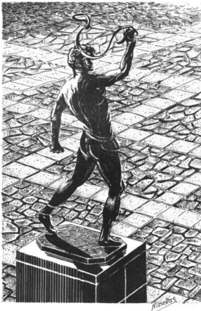
Palma. Monument al foner.

adaptant-se a la topografia de l'indret. Si sol entrar per una porta situada a ras de terra, per un passadís subterrani o pujant per una rampa que dóna a la part alta. Els corredors eren tan estrets que tan sols permetien el pas d'una persona rera altra. La coberta era de falsa cúpula, terrassa o teulat de ramatge sostengut per bigues d'alzina, ullastre o ginebró. El poble n'ha popularitzat el nom de “cabanes de roter”.