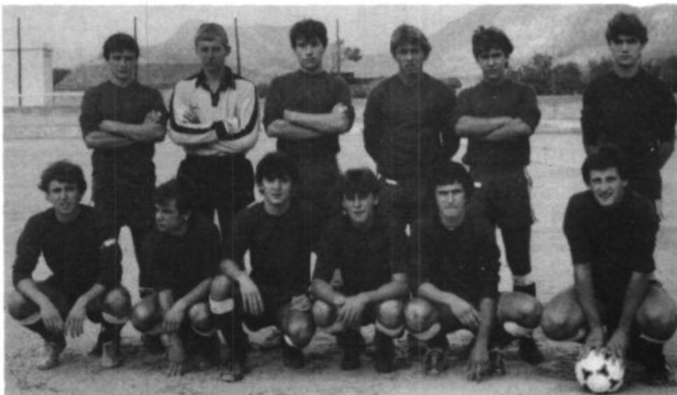
Equipo juvenil del C. D. Artà.