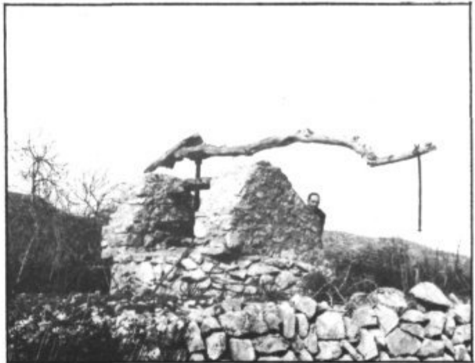
Prop de sa sinia feren carn Na Qüic i es canot.

Vaig estar a punt d'ofegar-lo. Com el me devia mirar