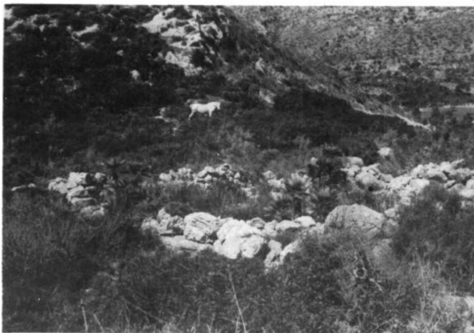
Naviformes de Coll de sa Barrereta, de la misma alquería. Observe, como anécdota, al fondo, un caballo blanco pastando.

Una sola observación: "Torm" es un topónimo mozárabe que significa "Peñascal" y no es frecuente. En Mallorca conocemos el Torm de la Seda en Pollensa; el Torrent del Torm y Es Tormàs en Escorca; y en Menorca, el Torm de Biniarroi, el Torm de Na Bribona, el Torm d'Alcaufar, el Torm de Torralbenc y la Punta des Torms. La lengua mozárabe es la que hablaban los indígenas baleares antes de islamizarse. Era un bajo latín fuertemente influenciado por la lengua del hombre prehistórico, lengua indoeuropea, posiblemente filocéltica o filo ibérica, quizás esta última.