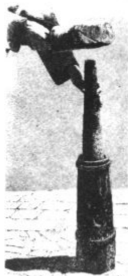
PREMSA DE TABAC AMB FUNCIONS