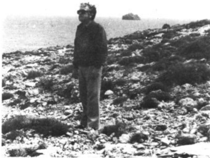
Miraculosament ES SAULONAR està talment com estava quan els artanencs que segaven a Ciutadella desembarcaven d’es llaüt que els tornava.

—No putes, patró. Això ho defensaré fins a lo darrer. Aquí duc cent dies de sang i suor. Per a tirar es “bulto”