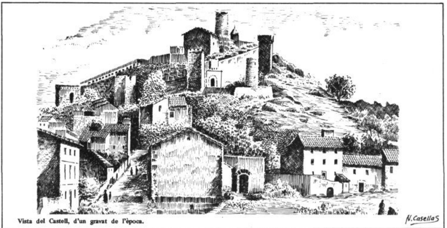
Vista del Castell, d'un gravat de l'època.

Del Castell en resten les muralles ben conservades, amb 5 torres i 2 portals de mig punt; el dit del Rei En Jaume i el ja esmentat abans. Un caminó empedrat condueix a l'antiga casa del Governador que està emplaçada vora la Torre d'En Banya, altre temps enrere convertida en molí de vent... L'església pertany al 1577 i té un portal d'arc apuntat, amb rosetó, creu i finestres ojivals. La nau gòtica disposa d'un retaule de la Patrona i el púlpit, on segons la tradició hi predicà el famós S. Vicenç Ferrer. Des dels afores colombram Son Jaumell, les cales Agulla i Moltó, Els Pelats, el Molí d'alt (de dolços records personals), el Puig Bessó i la nostra contrada artanenca que tants lligams l'uneixen amb la gabbellina.