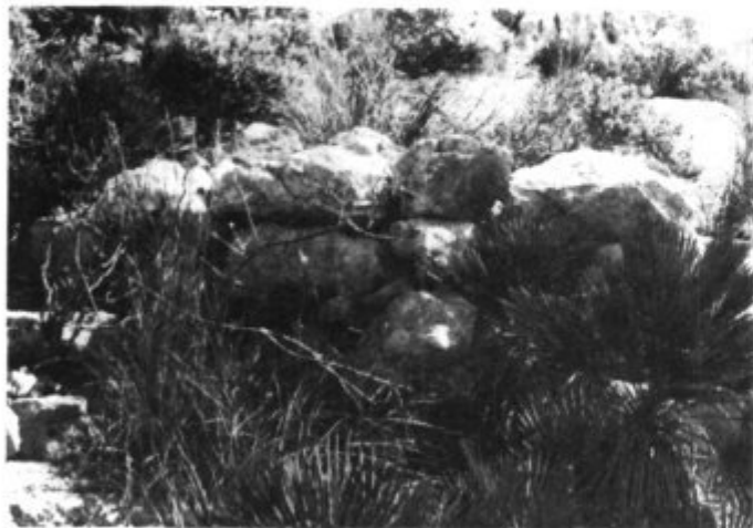
S'Alqueria Vella d'Avall. Puig Figuer (Artà)

El Museu estuvo instalado primero en la Caja Rural, hasta su extinción en 1941, pasando después al Instituto Católico hasta principios de 1982 en que fue trasladado a un nuevo edificio donde todos sus materiales han quedado perfectamente instalados.