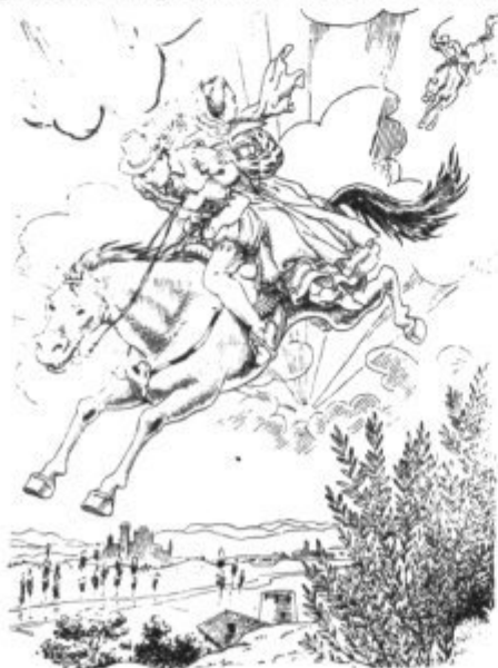
Il·lustració d'un llibret de Rondalles Mallorquines.

Rondalles, contes, faules, llegendes i contarelles són models típics de literatura fantàstica. "Fantàstic" guarda relació amb fantasia, però indica també el valor extraordinari que tenen determinades coses. Els contes populars, a més de l'ajuda que donen als infants, transmeten herència cultural dels segles, per una tradició constant, perpètua i universal. Se'n conten d'ídentsics en qualsevol idioma, perquè responguin als problemes humans de la manera per