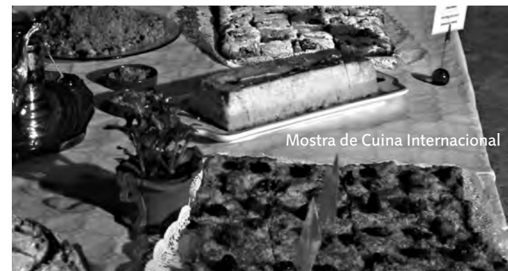
Mostra de Cuina Internacional