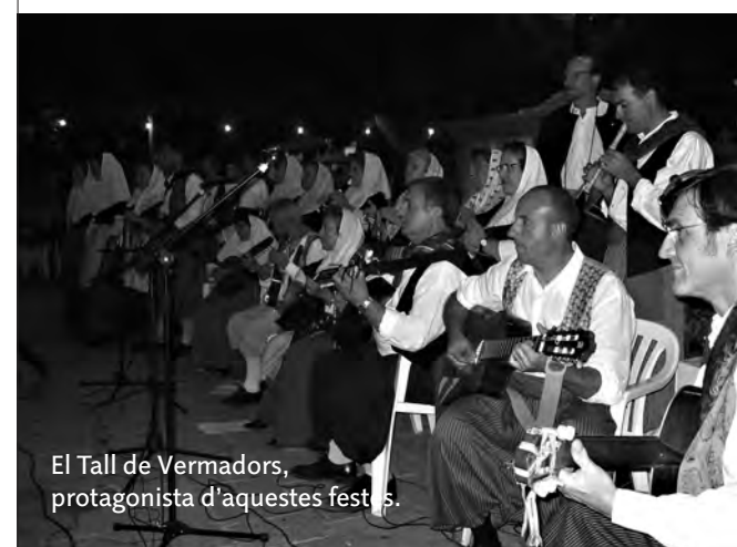
El Tall de Vermadors, protagonista d'aquestes festes.