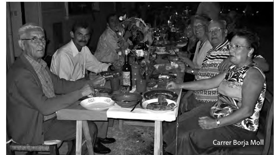
Carrer Borja Moll