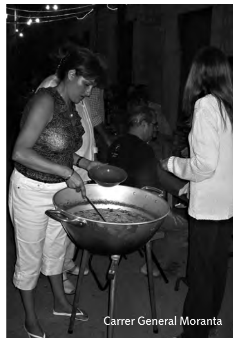
Carrer General Moranta