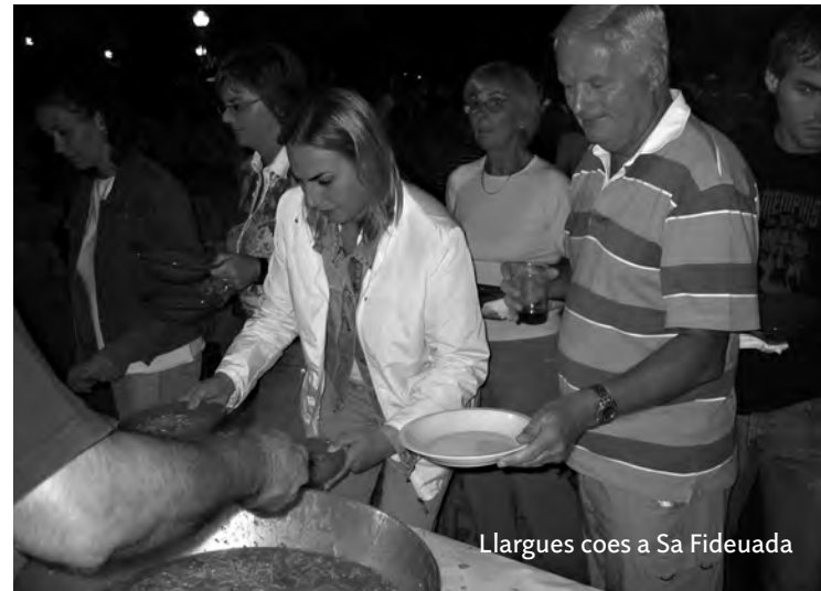
Llargues coes a Sa Fideuada

I si ja flàssim prim i volguéssim saber la quantitat (aproximada) de fideus que aquell vespre se serviren a taula, sabent que per a cada 10 persones hi ha qui en posa un quilo dins s'olla, idè... feis comptes!