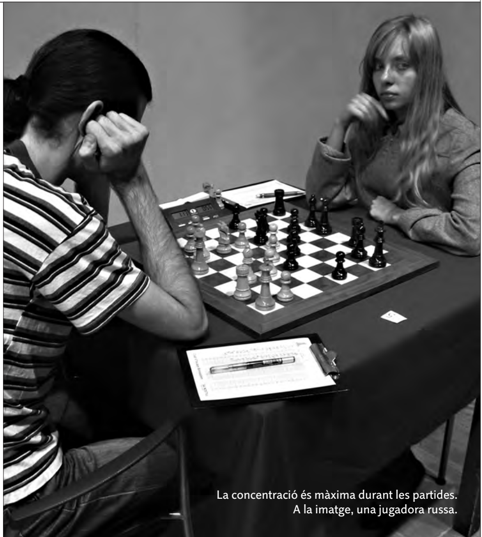
La concentració és màxima durant les partides. A la imatge, una jugadora russa.