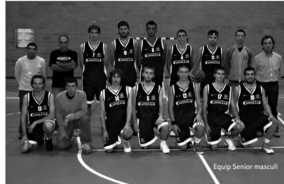
Equip Senior masculí

Els equips Senior masculí i Senior femení del club Bàsquet Binissalem, ja han donat inici a la temporada 2005/2006.