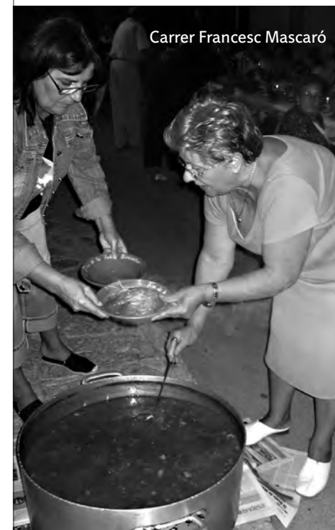
Carrer Francesc Mascaró