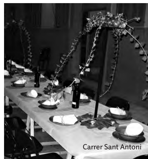
Carrer Sant Antoni