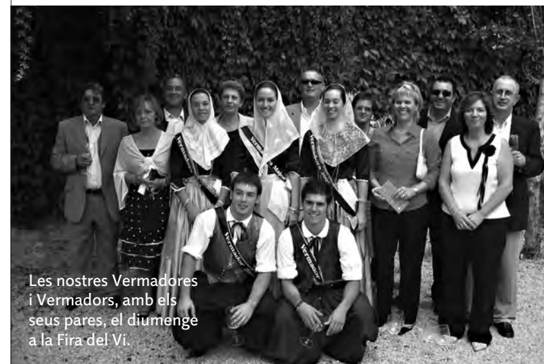
Les nostres Vermadores i Vermadors, amb els seus pares, el diumenge a la Fira del Vi.