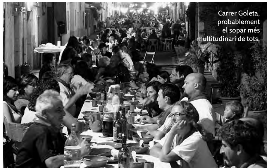
Carrer Goleta, probablement el sopar més multitudinari de tots.