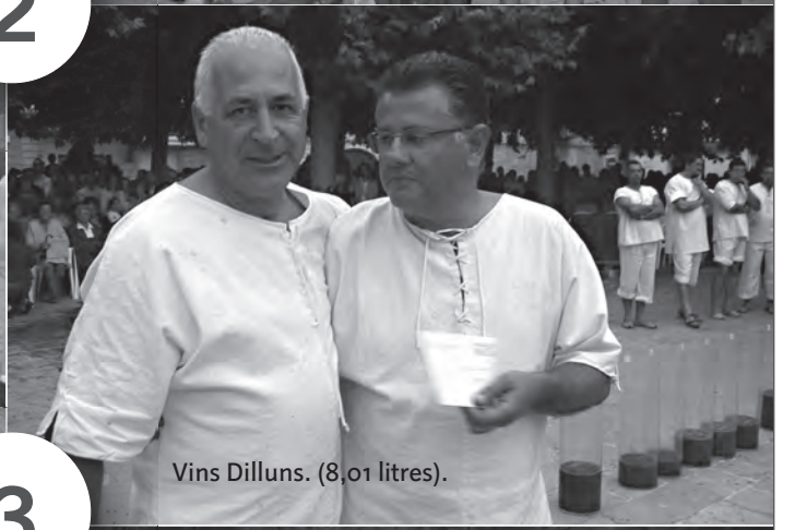
Vins Dilluns. (8,01 litres).