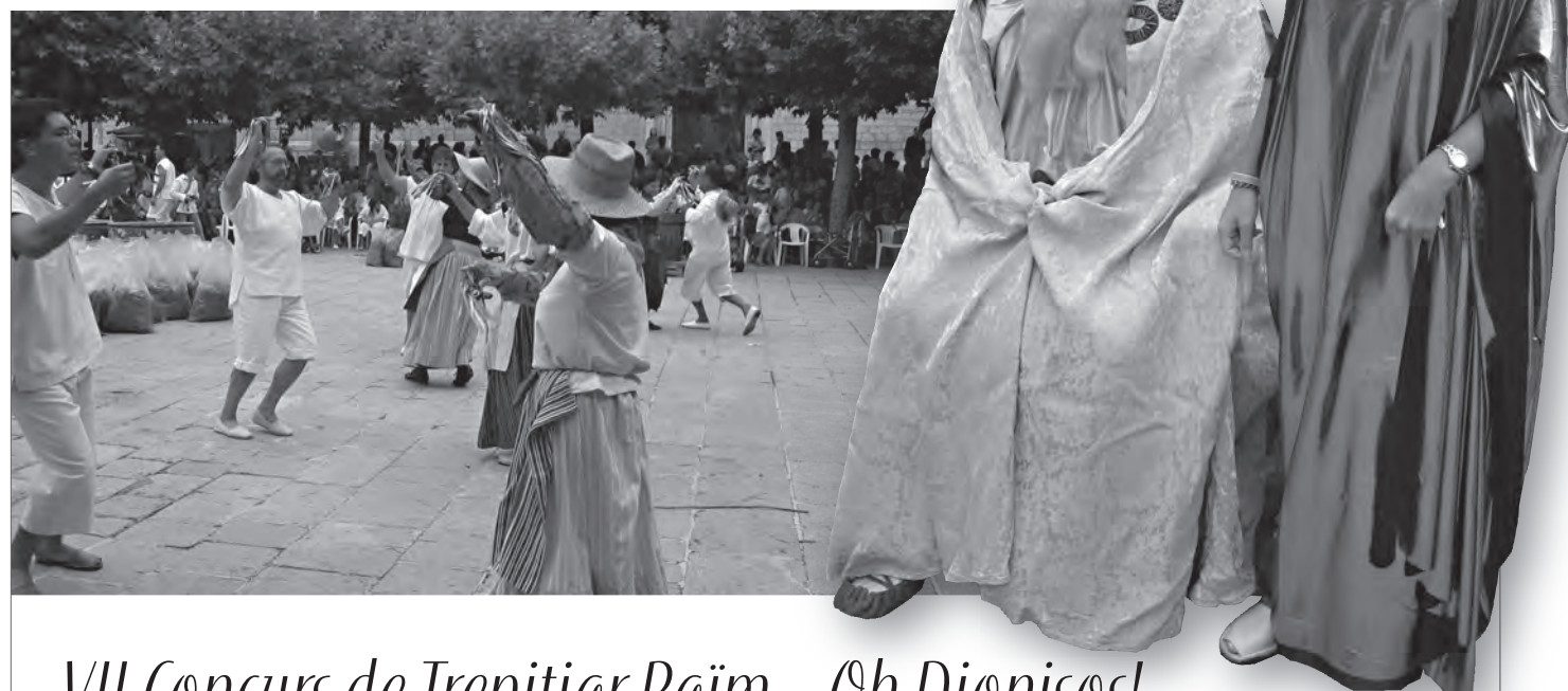
VII Concurs de Trepitjar Raïm... Oh Dionisos!