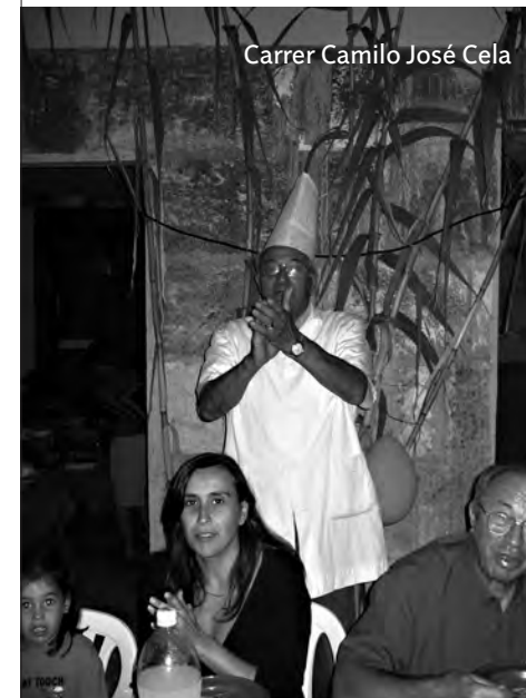
Carrer Camilo José Cela