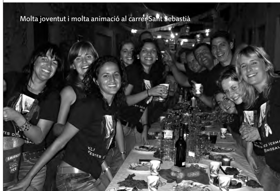
Molta joventut i molta animació al carrer Sant Sebastià