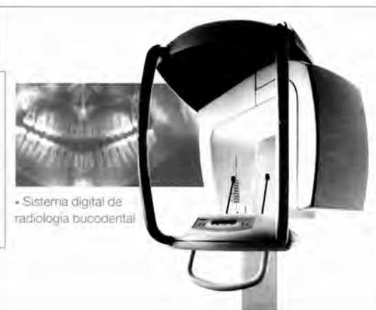
• Sistema digital de radiologia bucodental

Sa Coma, 21 07350 Binissalem tel.&fax 971 886 398 consulta@binident.com www.binident.com