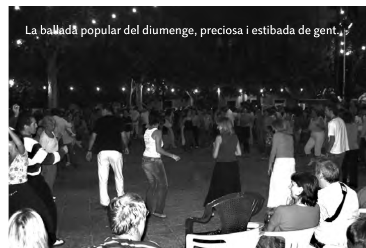
La ballada popular del diumenge, preciosa i estibada de gent.