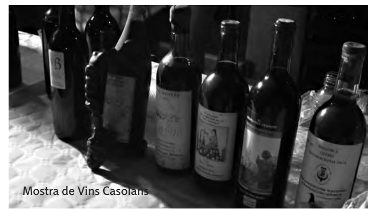
Mostra de Vins Casolans