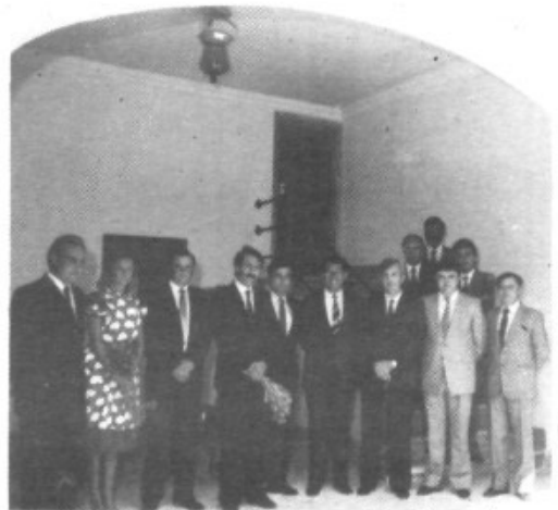
Su edificación fue realizada por la empresa Rigo-Ribot.