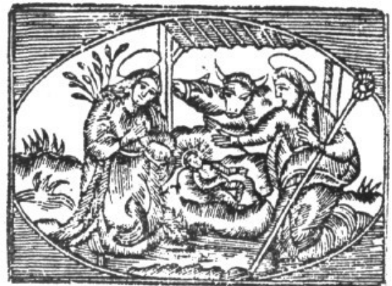
FELIÇ I PROFITOS ANY 1984