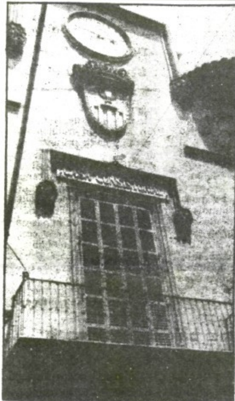
El Ayuntamiento de Felanitx