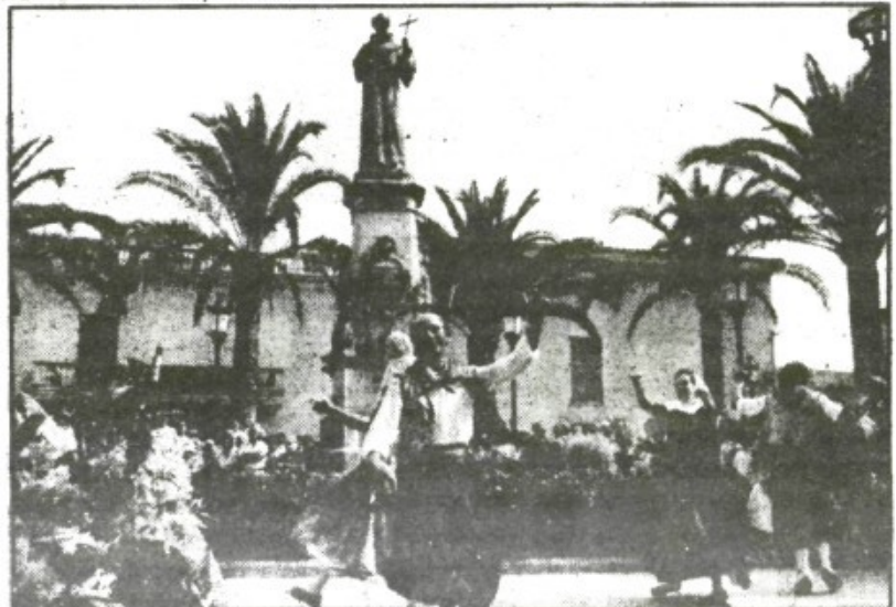
-1- Grupos de baile amenizaron los actos.

A los actos de la jornada Ariany estuvo presente por medio de nuestras Autoridades Municipales, participación que nos honra. Por otra parte no queremos disimular la extrañeza de que la Parroquia, como tal, una vez más no fuera invitada a dichos actos. Consideramos que Junípero Serra es de todos y a todos debe interesar en especial a las Comunidades cristianas.