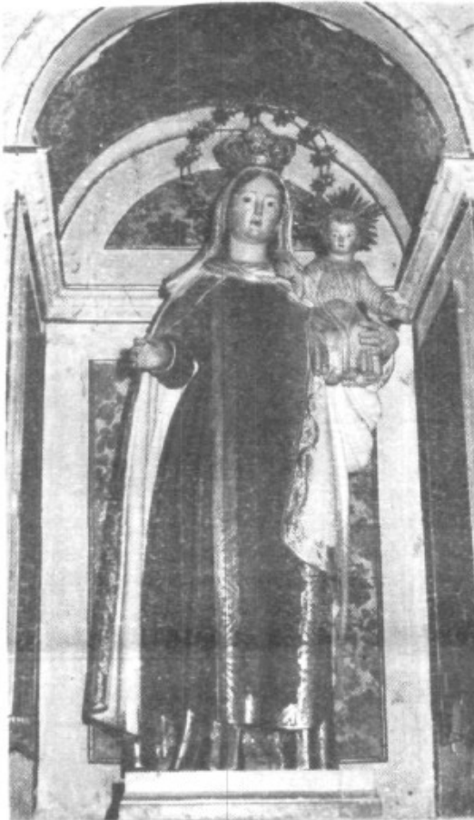
Imagen de Ntra. Sra. del Carmen hecha por el escultor Vicente Matas el año 1856.

De Escapularis de la Verge del Carme venuts desde el dia de la seva festa hasta el present . . . . . 10 lliures 6 sous 8 diners.