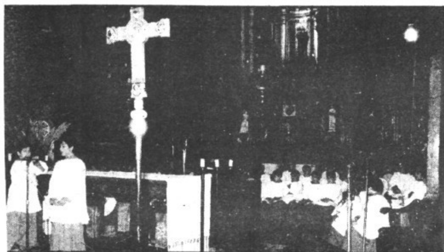
La Basílica de Lluc, casa común de los mallorquines

Estimats germans i germanes, preveres, religiosos, religioses i laics de l'Església mallorquina: