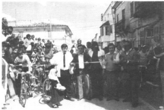
MOMENTO DE LA SALIDA OFICIAL DE LA PRUEBA. EL ALCALDE CORTA LA CINTA EN PRESENCIA DE LOS ORGANIZADORES.