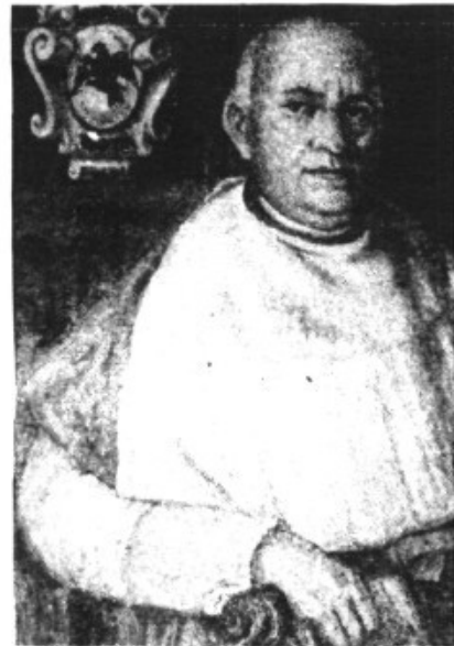
MERESCUT HOMENATGE A Mn. ANTONI MARIA ALCOVER I SUREDA.

Els cinquanta anys de la seva mort anima el nostre poble a tributar-li un senzill però emotiu homenatge d'agraïment degut al seu ingent i magisterial treball a favor de la nostra cultura.