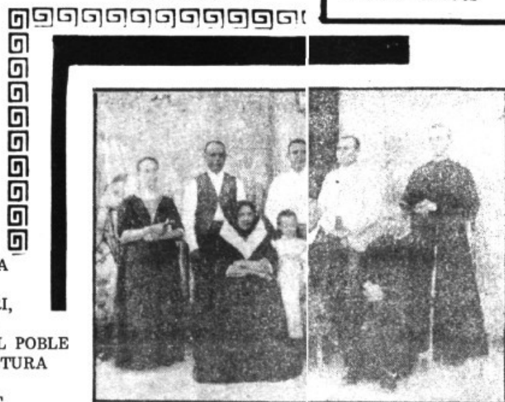
Mn. ni amb els seu pares y germ

• No va renunciar mai, ni de paraula ni amb fets, de les seves arrels