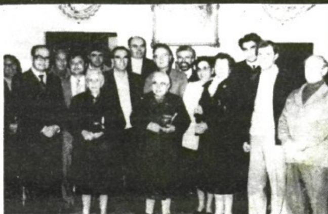
Familiars de don Antoni Maria Alcover i autoritats d'Ariany i Manacor, retrats poc després d'acabar l'homenatge

Vivió y murió en una época que no era la más propicia para juzgar verazmente y con la misma comprensión que se han juzgado a otras personas; por otra parte "los últimos cuarenta años", ni para él, ni para nuestra cultura autóctona han sido una época favorable.