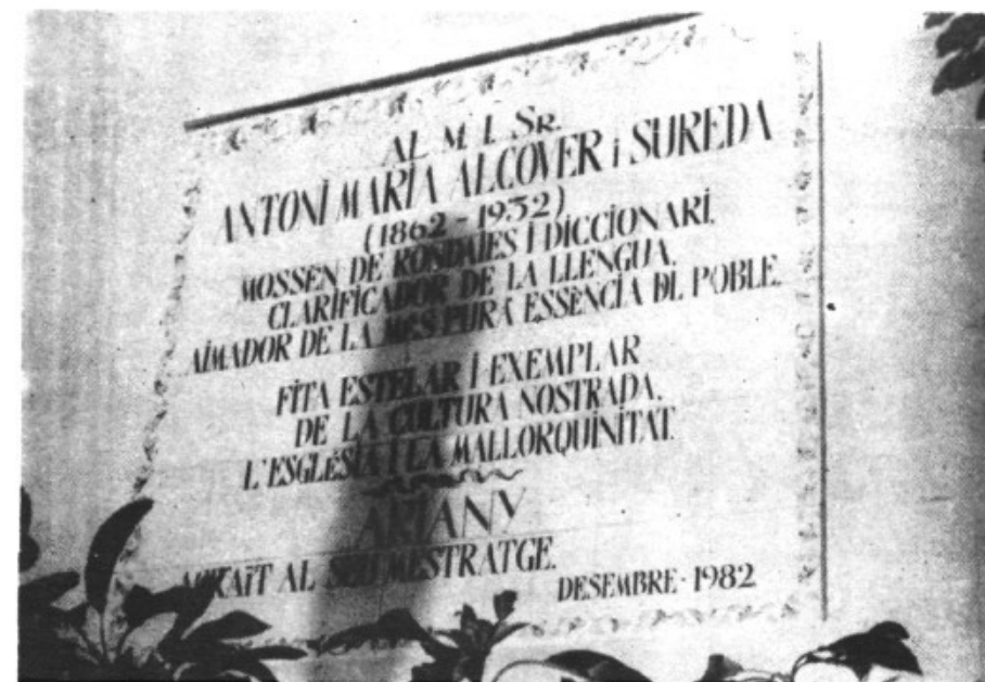
Esta es la lápida que el pasado 19 de diciembre fue solemnemente inaugurada.

Sembla que par damunt Santa Cirga volin encara aquelles fades que l'astorada fantasia de mossèn Alcoverbarriolà entre la prosa més sucosa i autèntica, o encara cavalqui aquell Bernadet Fill de Rei - ros seria ell com l'or o el blat - tot cercant el possible amor de les tres taronges? si; tot ho és, manco que a Santa Cirga i a tot arreu torni néixer un infant com aquell.