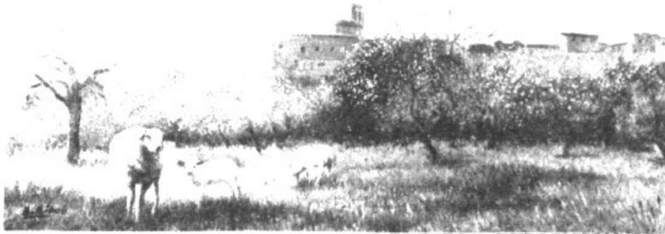
PRIMERA EXPOSICION DE PINTURA.