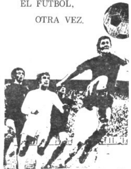
EL FUTBOL, OTRA VEZ.

Director de la Banda de Música de Maecor