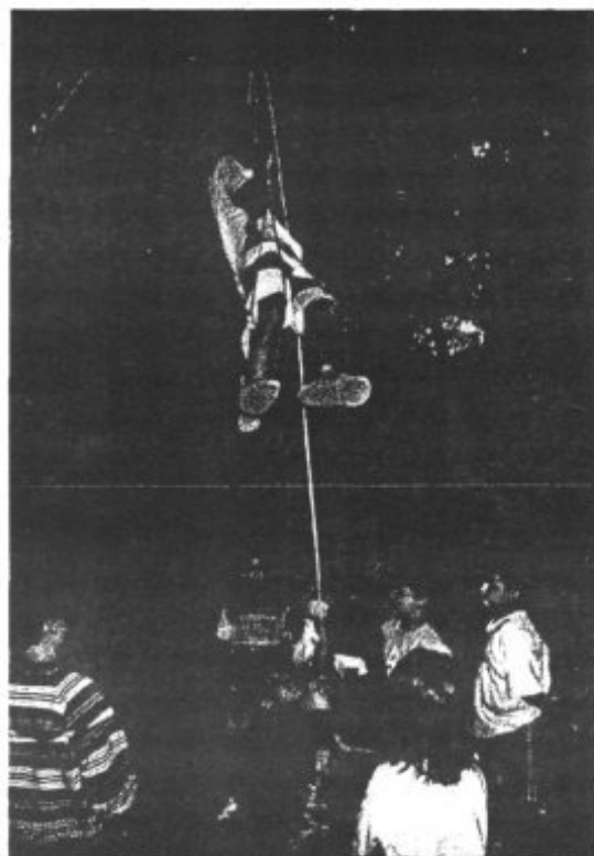
També experimentàrem esports d'aventura