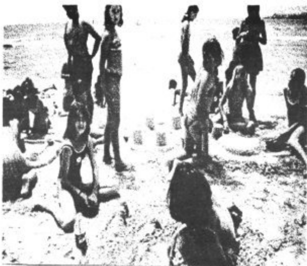
La mostra de castells d'arena fou un èxit