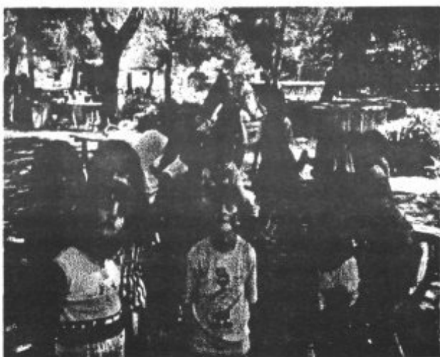
També hi hagué moments per pintar-se la cara