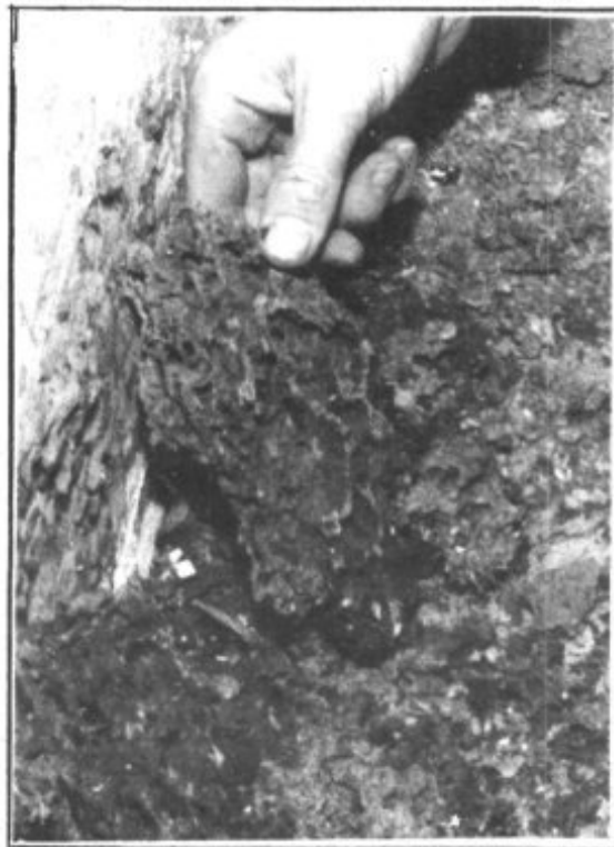
Las termitas devastan por completo la madera.

parte de diversos escultores de la familia Homs. La iglesia, de porte románico y típica estructura franciscana, tiene su origen en una construcción primitiva comenzada a levantar en 1.606. Es el único centro religioso habitado en la actualidad en Mallorca por la Orden Franciscana Menor ( OFM ) y tiene y guarda un capítulo propio en la historia por ser el lugar de la formación inicial de Junípero Serra, nacido en los aledaños del templo y conocido como evangelizador de California. El convento, después de ser, entre otras cosas, casa de formación y colegio