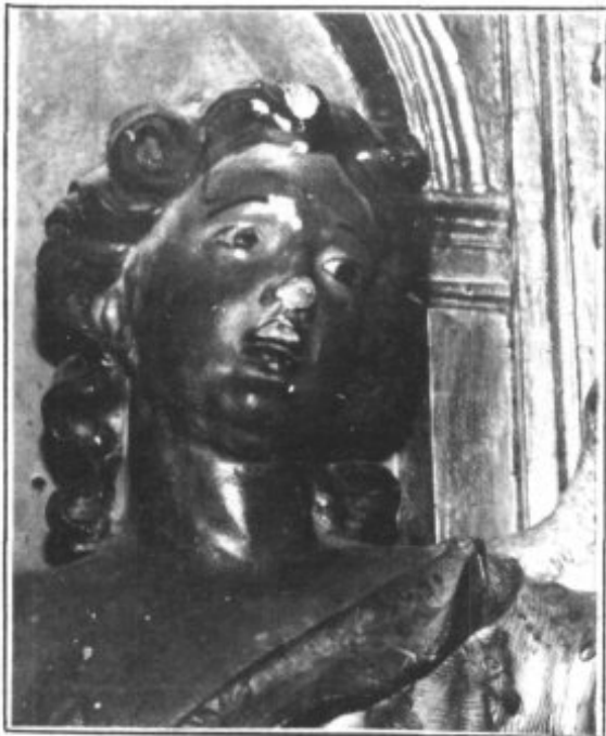
Algunas figuras aparecen visiblemente dañadas.

los retablos - es posible acceder directamente a ellos- como en las esculturas y retablos tanto del altar mayor y de los altares laterales. El trabajo de exterminio,