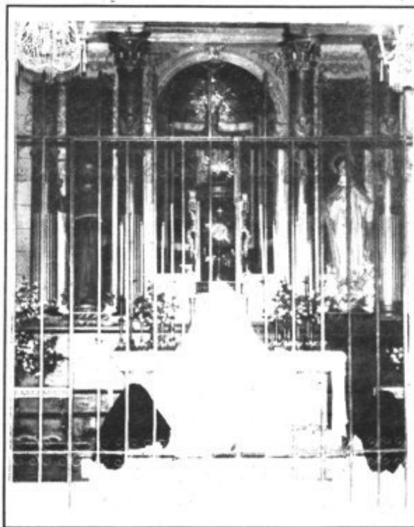
Antiguo altar mayor de la iglesia.

lles adyacentes se encontraban alfombradas con variadas hierbas aromáticas, que perfumaban el ambiente.