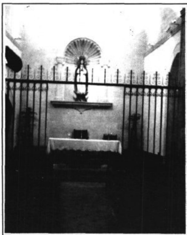
Actual Altar Mayor de la iglesia.