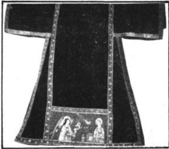
Dalmàtica del "tern dels Innocents"

Les peces més antigues conservades daten del Segle XV. totes elles obres d'altíssim valor dins l'Art Gòtic Mallorquí, com són en orfebreria, la Custòdia i el Píxide; en teixits, el "Tern dels Innocents"; o en pintura, el retaule de "Los Sants Metges".