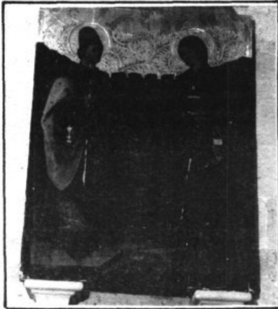
Retaulé de Sant Cosme i Sant Damià. "Los Sants Metges"

rrregar de moblar alguna capella; un exemple significatiu és la capella de "Los Sants Metges", que des del Segle XVI fins a principis del XX, té com a protectors a la mateixa família, on es succeïxen els llinatges dels Ramiro, Garau d'Axertell, Oms i finalment Gual de Torrella.