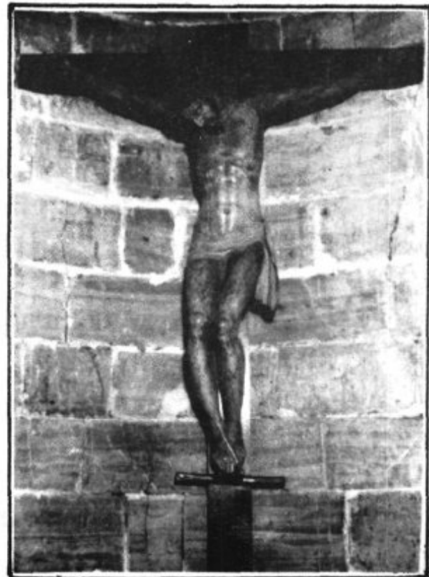
Pas del Sant Crist. Talla probablement del s.XVII

El mobiliari de l'Església Parroquial de Sant Pere de Petra, constitueix el més valuós i abundant conjunt d'obres d'art moble d'aquesta vila, essent un bon repre-