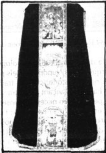
Casulla del "tern dels Innocents"

Del Segle XVI destaca el retaule de Santa Aina, bell exemple de la transició del Gòtic cap al Renaixement. Ja dins l'estil renaixentista trobam els retaules del Nom de Jesús i de Sant Sebastià.