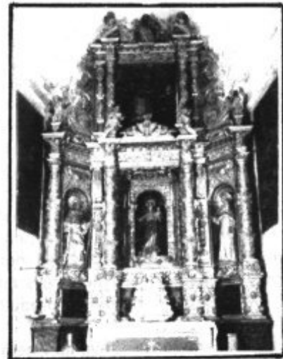
Retaule de la Mare de Déu del Roser