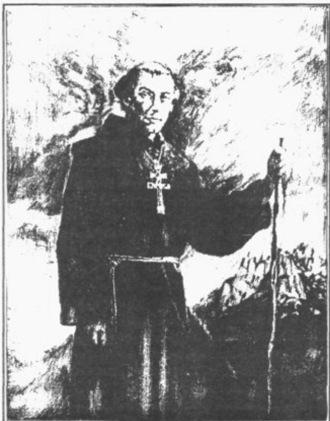
Beato Fray Junípero Serra