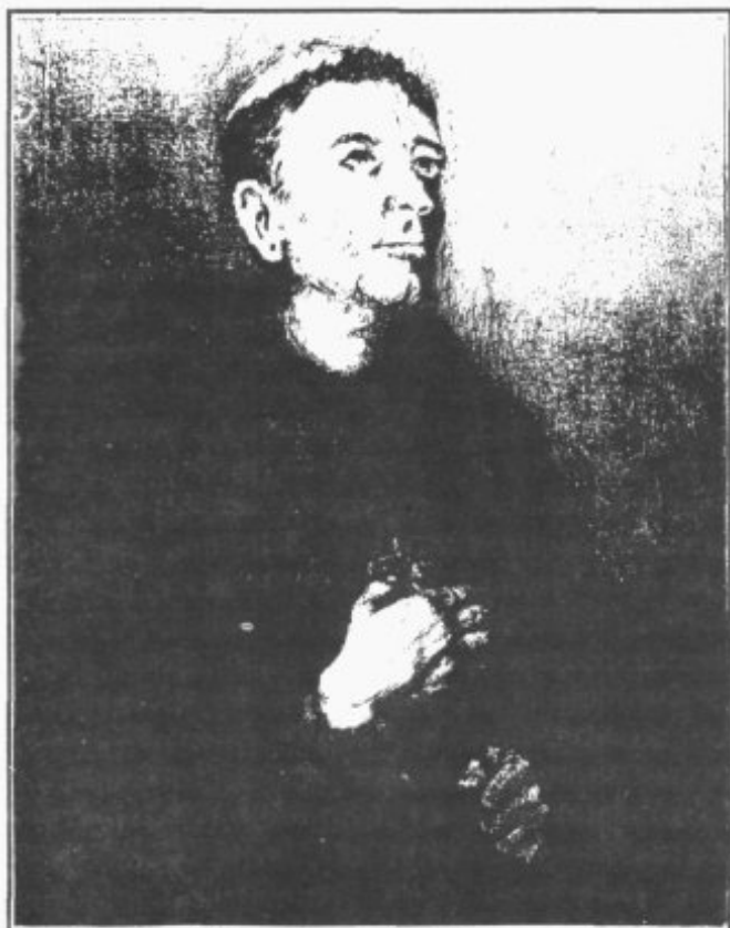
Fray Francisco Palou