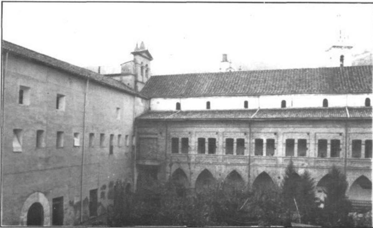
Real Monasterio de Sta. Clara de Játiva, fundado en 1326. Ciudad de los papas Calixto III y Alejandro VI. Por encima del Monasterio se asoman la cúpula y campanario de la Colegiata, y al fondo, las murallas del Castillo.