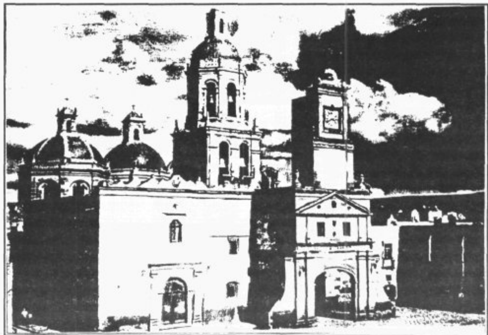
Iglesia y Colegio Apostólico de Sta. Cruz de Querétaro, México

El gran americanista, Pedro Borges, viene a decirnos con su autoridad que, el descubrimiento significó la hora de la llamada franciscana de América. Los franciscanos se sienten especialmente llamados por Dios para