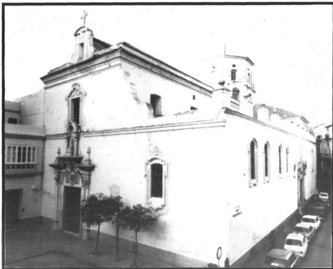
Iglesia de San Francisco de Cádiz, con la fachada del Convento al lado izquierdo de la foto. Aquí vivió Fray Junípero Serra, desde el 5 de mayo al 28 de agosto de 1749, en espera de embarcar hacia América.