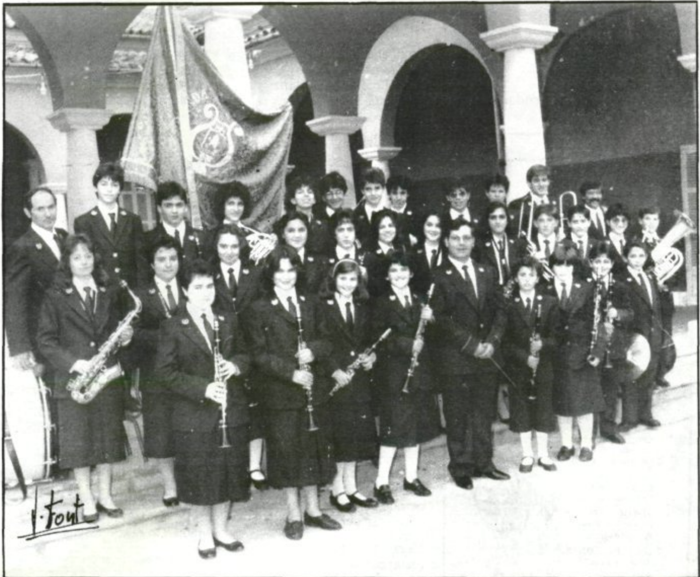
LA JOVEN BANDA DE MUSICA DE PETRA