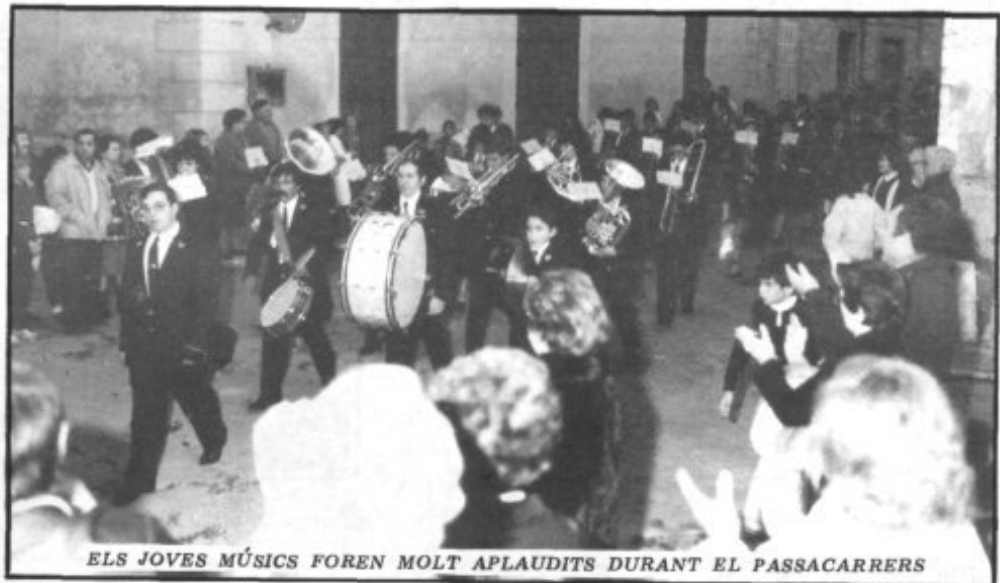
ELS JOVES MÚSICS FOREN MOLT APLAUDITS DURANT EL PASSACARRERS