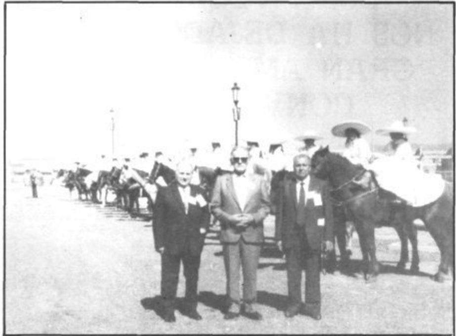
EN SU VISITA A MEJICO EL ALCALDE DE PETRA FUE RECIBIDO Y AGASAJADO COMO SE LO MERECE