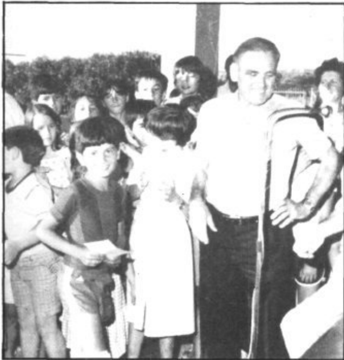
IGUAL TRATABA CON LOS NIÑOS QUE CON LOS MAYORES

logró una capacidad más que regular para poder salir airoso de los trances más o menos comprometidos, en que se ha visto por razón de sus cargos.