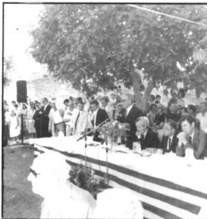
EL DIA DE LA PRESENTACION DEL LIBRO “LA VILLA REAL DE PETRA”

Y una vez arrebatado de entre nosotros, el incesante desfile de vecinos de Petra para ofrecer su condolencia a los familiares, desde que se tuvo la noticia del fallecimiento hasta la última hora de la noche?