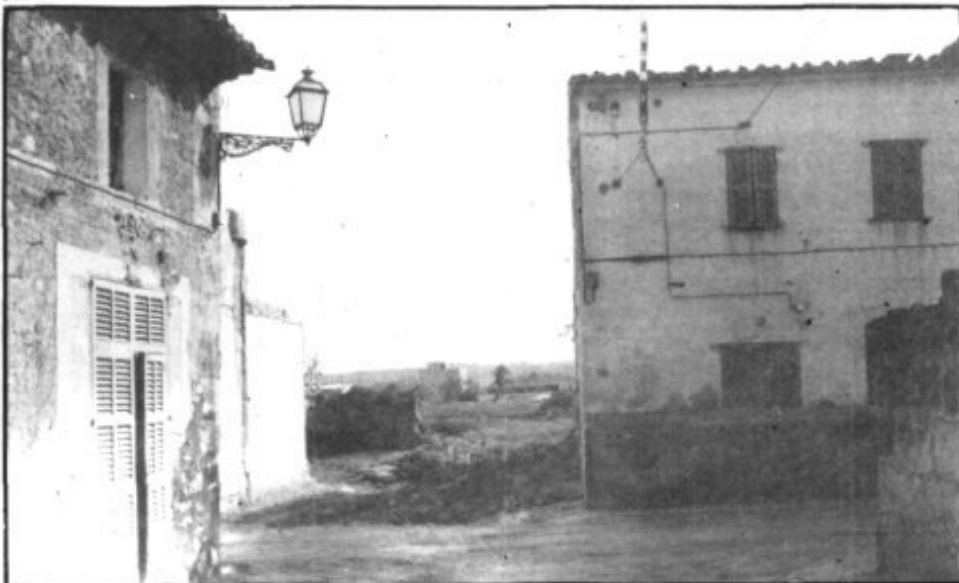
LA APERTURA DE LA CALLE CALIFORNIA FACILITA EL ACCESO AL ENSANCHE DONDE ESTA SITUADA LA PISCINA MUNICIPAL