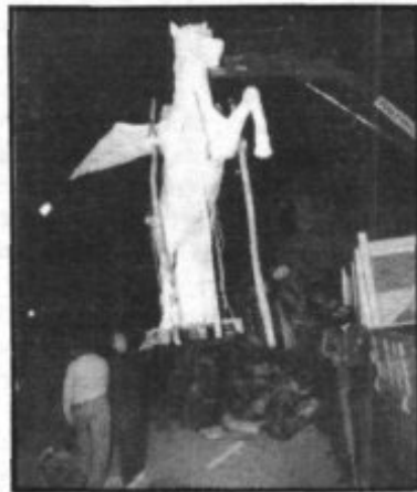
Fogueró de Ca'n Coleto. Una pequeña imagen dice más que una frase larga.

El torneo de "Els Arcs" se prolongará probablemente por espacio de unos dos meses y como los demás, concluirá con la consabida cena de clausura y su consiguiente entrega de premios y distinciones. En esta 7ª edición el torneo ha incluido en sus bases una novedad adicional con la intención de incrementar su interés: la pareja que se encuentre clasificada en primer lugar en la mitad del torneo será obsequiada con un par de entradas para presenciar el encuentro de fútbol entre el Mallorca y el Real Madrid.