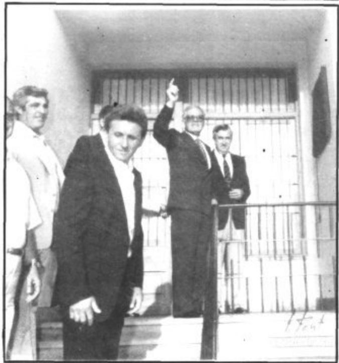
EL DIA DE LA INAUGURACION DEL HOGAR DEL PENSIONISTA