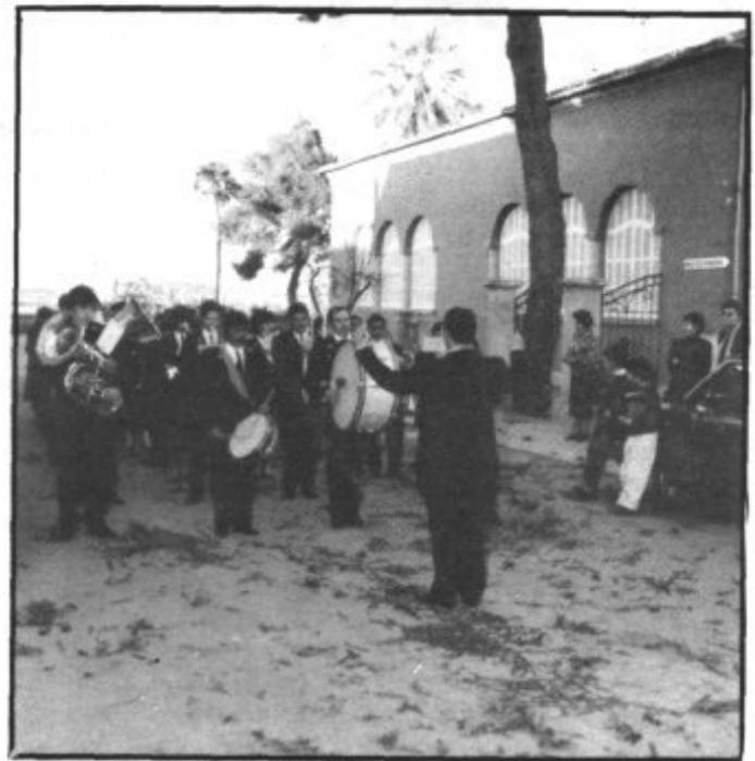
MOMENT HISTÒRIC. LA BANDA DE MÚSICA DE PETRA SURT PER PRIMERA VEGADA AL CARRER