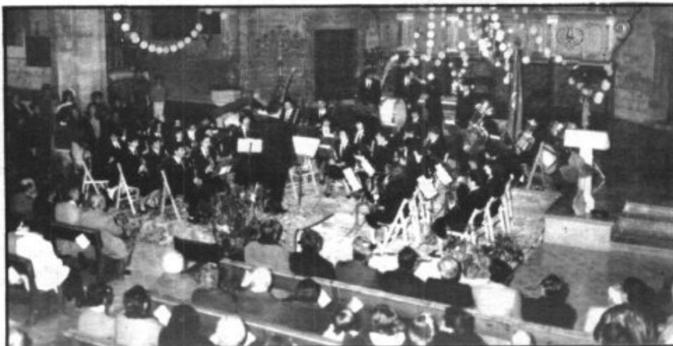
GRANDIÓS FOU EL CONCERT DE LA BANDA DE PETRA AL SEU ACTE INAUGURAL