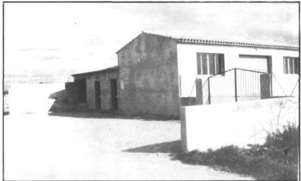
EL MATADERO. UNA DE TANTAS OBRAS REALIZADAS MIENTRAS EL ALCALDE OLIVER ESTUVO AL FRENTE DEL CON- SISTORIO

Por si fuera poco, desde el primer momento se nos dijo a todos: "Están a disposición del público en general, los libros, registros y documentación muni- cipales, para ampliar detalles, y para facilitar cuanta mayor información se desee saber sobre todo lo que concierna al Ayuntamiento". (Actuación Municipal. 1981)