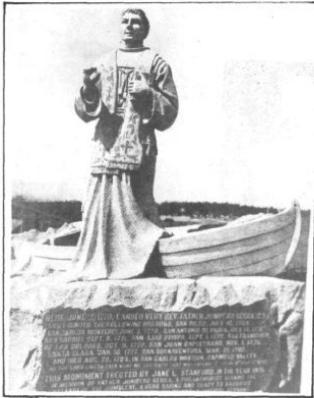
ESTATUA DEL PADRE SERRA EN MONTERREY