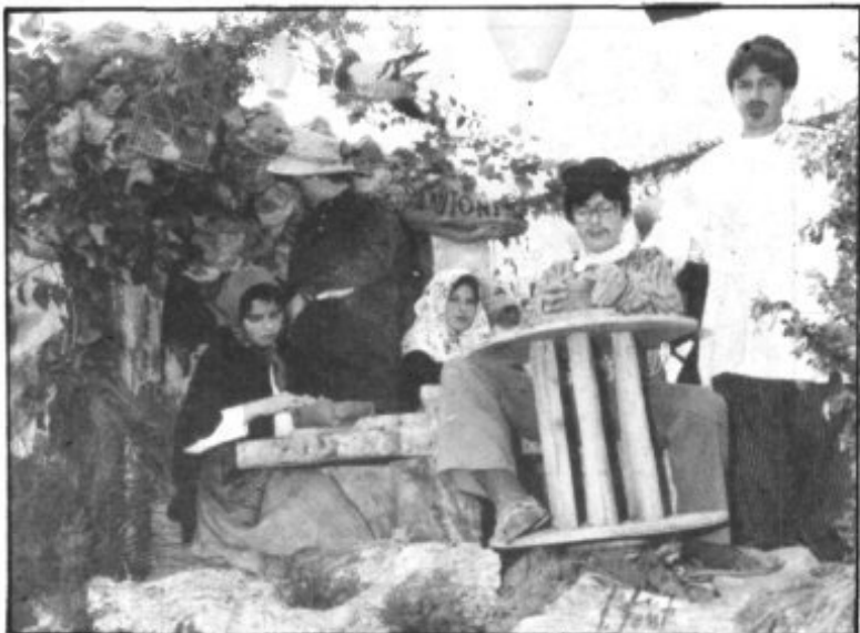
CARROZA GANADORA DEL PRIMER PREMIO