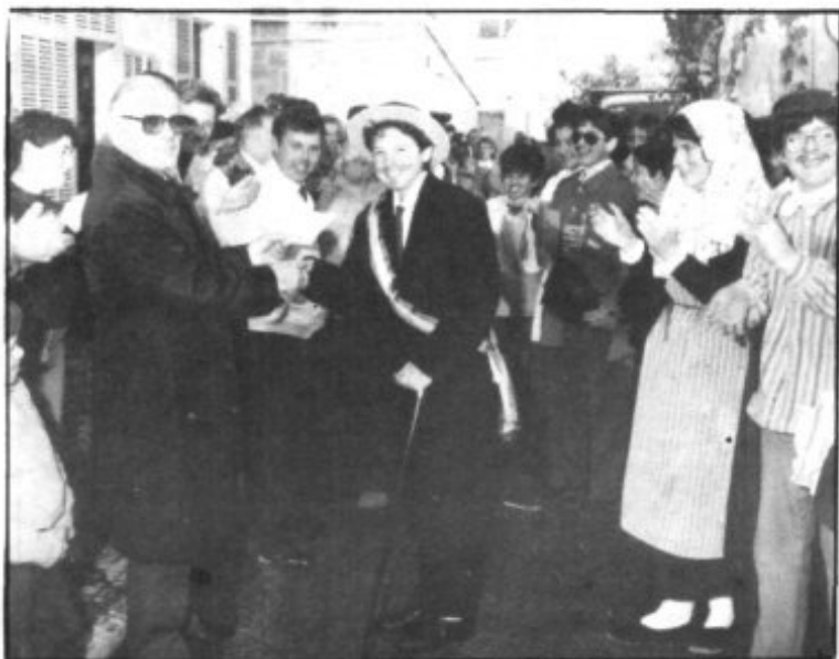
ENTREGA DEL PRIMER PREMI