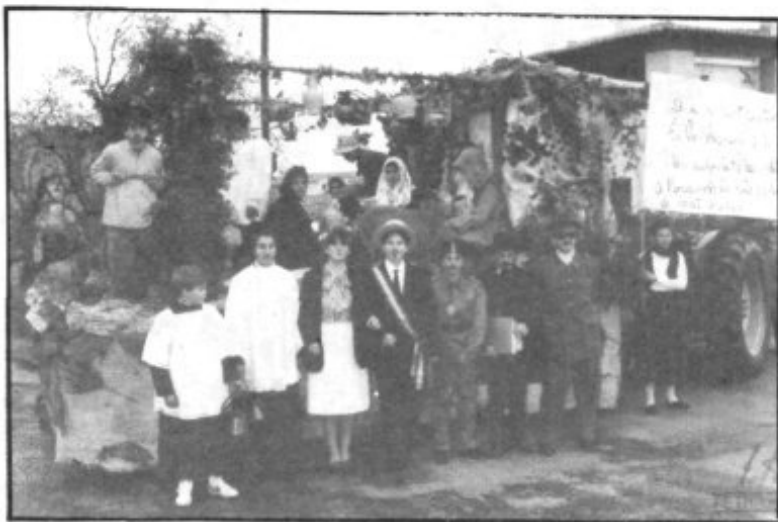
GRUPO DE ALUMNOS DE OCTAVO DE E.G.B. ORGANIZADORES DE LA CARROZA CLASIFICADA EN PRIMER LUGAR.