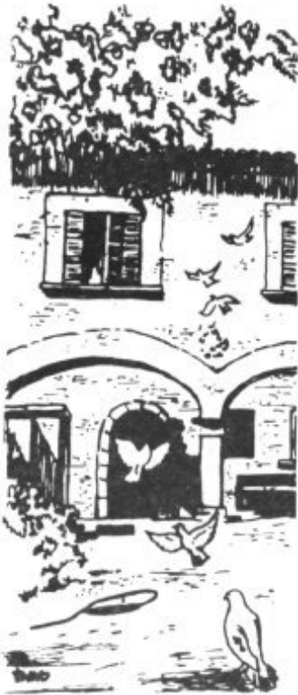
MUSEO FRAY JUNIPERO SERRA

causas naturales, sino a la intervención de él, ya sean los cuatro "prodigiosos" sobre los que se está investigando, u otros. Encaminadas a este fin son necesarias nuestras plegarias.