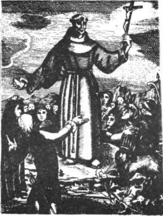
Grabado del siglo XVIII

El día 8 de Mayo de 1985, la "Sagrada Congregación para la Causa de los Santos", promulgó el Decreto por el que la Iglesia Católica declaraba como "Venerable" al Siervo de Dios Junípero Serra, sacerdote profeso de la Orden de Hermanos Menores, nacido en Petra (Mallorca) el 24 de noviembre de 1713 y muerto en el 28 de agosto de 1784 en Monterrey (California, U.S.A.) Por errores de transcripción se dió como fecha de nacimiento el 21 de noviembre de 1731. Felizmente coincidente es que la promulgación haya tenido efecto recién cumplido el bicentenario del fallecimiento del Padre Serra y cuando ya se han iniciado los preparativos para conmemorar el V Centenario del Descubrimiento y Evangelización de América.