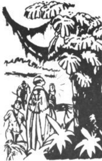
gráfico dedicado al fraile franciscano y misionero mallorquín.

Este centro de Estudios Teológicos de Mallorca que viene publicando interesantes escritos sobre su tema, quiso unirse al Bicentenario Serra publicando un número extraordinario y mono-