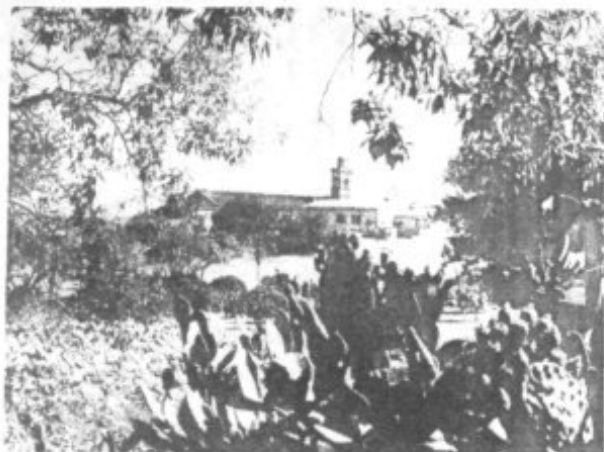
CONVENTO DE SAN BERNARDINO PETRA