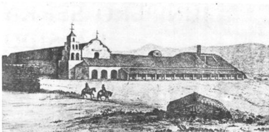
LA MISION DE SAN DIEGO EN 1846