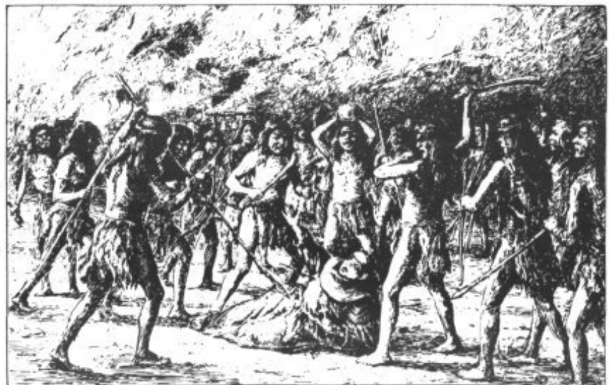
MARTIRIO DEL P. LUIS JAUME

Instruirlos en el Evangelio, engendrarlos en Cristo. Esa fue la vocación específica de Fray Luís. Que su sangre vino a rubricar desvelos por las almas, lo declara el propio Junípero al superior del Colegio de San Fernando: "Ahora veo lo bien que trabajó el difunto padre en esta misión. Está traducido todo el catecismo en el idioma, y no es esto lo más, sino que de los mismos indios hay quien reza, haciendo las preguntas, y sugiriendo las respuestas y assí va la pronuncia de todo, como de quien lo ha mamado; y de muchachos catequistas con dicha habilidad hay tantos que sobre que cada rancharía tiene el suyo, acá en la misión son no sé cuántos..."