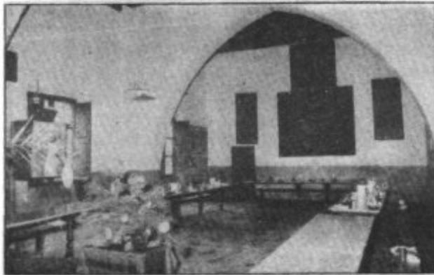
EL REFECTORIO DE LA COMUNIDAD DONDE AÑOS ATRAS SE PONIA MESA PARA CIEN RELIGIOSAS