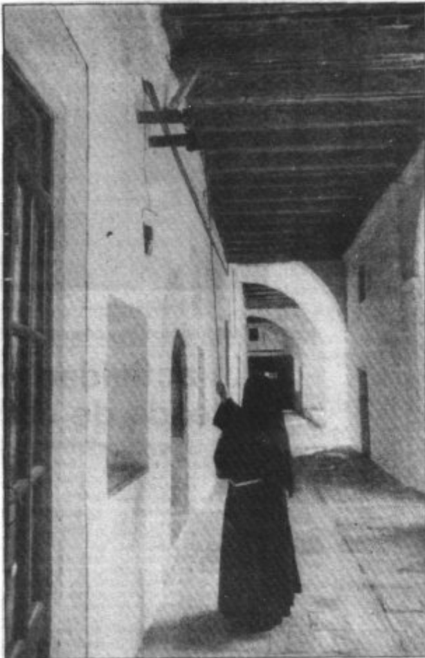
LA MONJA AVISA A SUS HERMANAS CON UN TOQUE DE CAMPANA CUANDO ENTRA UNA VISITA EN LA CLAUSURA

Con un programa propio de este acontecimiento y en su condición de religiosas de clausura, durante los días 12 al 16 de Enero las Clarisas celebraron estas efemérides en su convento de Palma de Mallorca.