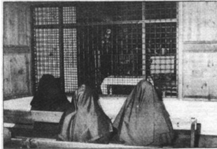
EL CORO BAJO DESDE DONDE LAS RELIGIOSAS HACEN VELA AL SANTISIMO