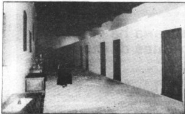
LA ESPACIOSA NAVE CON LAS CELDAS DE LAS MONJAS

otras de forma individual. A las 19, cantamos Vísperas, la corona franciscana y se hace la reserva al Santísimo y a las 20,30 cenamos y tenemos una nueva recreación. Después del canto de Completas nos vamos a descansar. No se olvide de decir que nuestro carisma es oración y trabajo. Tenemos expuesto el Santísimo todo el día y nos turnamos en continua vela, en el Coro bajo al que se entra por el claustro.