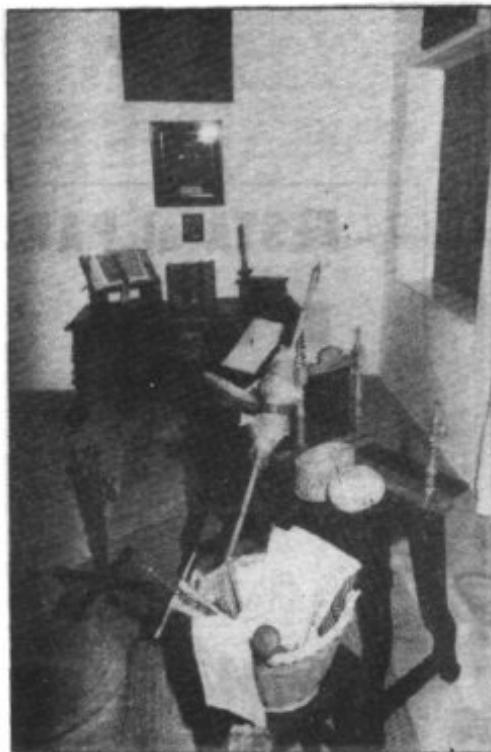
SALA DE DISTRIBUCION CON RICA Y ANTIGUA ORNAMENTACION