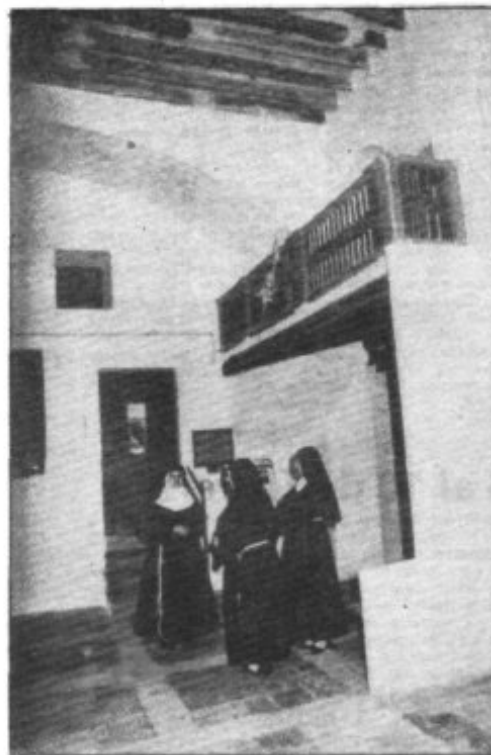
ENTRADA AL REFECTORIO CON EL BALCÓN DE LA ABADESA

urnas mortuorias están en el claustro a la entrada del monasterio. Antiguamente el cargo de abadesa era vitalicio, hoy según las nuevas normas se renuevan cada par de años por elección.