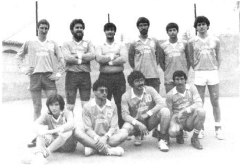
EQUIPO DE LA 3ª DIVISION ABSOLUTA DEL C.J. PETRA