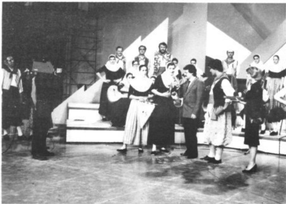
LA RONDALLA DES PLA ENTREGO UNA ESTATUA DEL P. SERRA A TELEVISION ESPAÑOLA

con destino a Madrid donde se llegó después de una hora muy tranquila y alegre de vuelo. Al llegar al Aeropuerto de Barajas el autocar de TVE nos estaba esperando para el traslado al hotel donde nos alojamos hasta el lunes por la mañana.