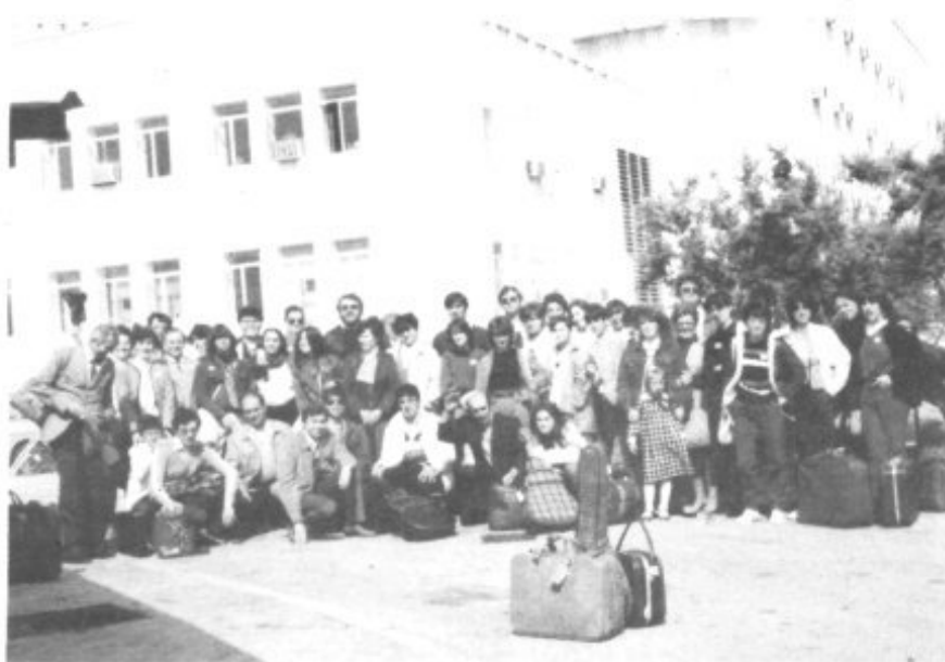
LA RONDALLA DES PLA POSA ANTE LOS EDIFICIOS DE TELEVISION ESPAÑOLA

Acto seguido se interpretó el baile Mateixa de Primavera que fue la segunda y última intervención. En esta ocasión la tranquilidad se había posesionado perfectamente de todos, los nervios se quedaron fuera y como fruto resultó una magnífica actuación.