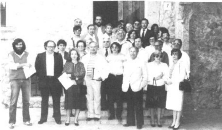
MIEMBROS DE LA "PREMSA FORANA" EN EL MONASTERIO DE LLUC.

El sábado 9 de Junio se reunió en Lluc la "Asociación de Prensa Forana" con un apretado programa del que cabe destacar tres aspectos: la entrega de la Medalla de la Asociación a la Imagen de Nuestra Señora, la presentación de la reedición de la "Guía de Lluch" (1884) y la proclamación y entrega de los premios instituidos por la asociación. La "trobada" acabó con una cena de amistad, que tuvo por marco el restaurante del santuario.