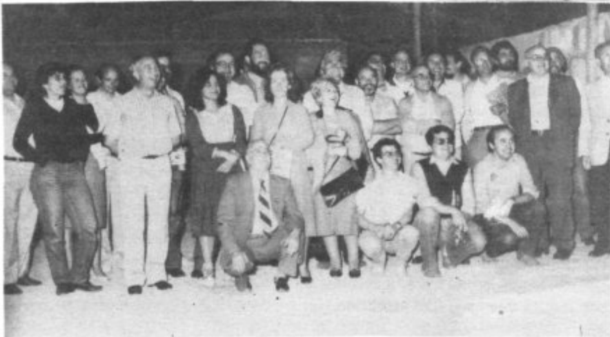
GRUPO DE COMPONENTES DE LA "PREMSA FORANA" LA NOCHE DE LAS ELECCIONES DE LA NUEVA JUNTA DIRECTIVA