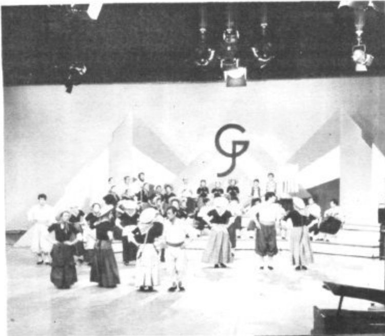
TRES MOMENTOS DE LA ACTUACION DE LA "RONDALLA DES PLA" EN LA PEQUENA PANTALLA