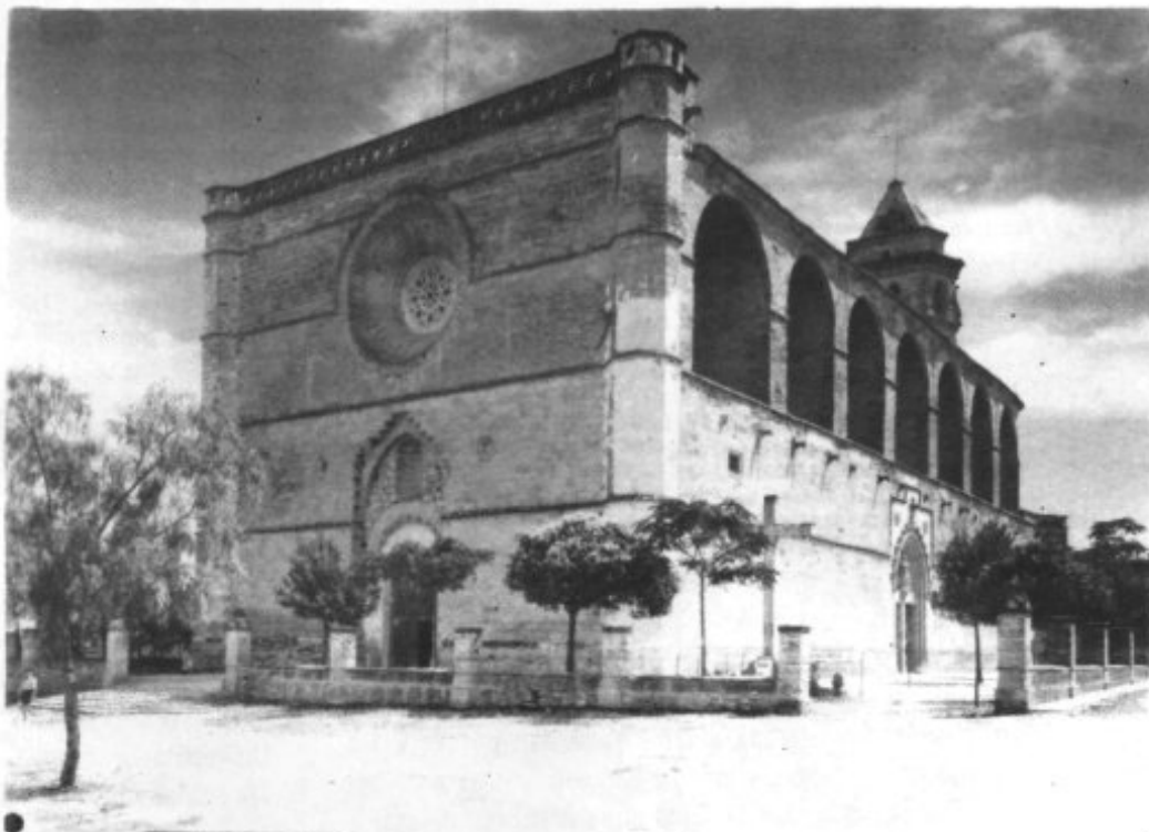
ESGLÉSIA PARROQUIAL DE SANT PERE, PETRA

L'any passat, el dia 30 de Maig, Petra celebrà amb gran solemnitat els 400 anys de la benedicció i col·locació de la primera pedra de l'ampliació del nostre temple parroquial de Sant Pere. Era la tercera església que construïen els petrers, de les quals tenim alguna notícia. La primera l'aixecaren al Barracar Alt, darrera el Convent. La segona a l'indret de l'actual parròquia, després de l'any 1300, any de la creació de la nostra Vila pel rei Jaume II. I aquesta tercera és la que fou ampliada l'any 1582.