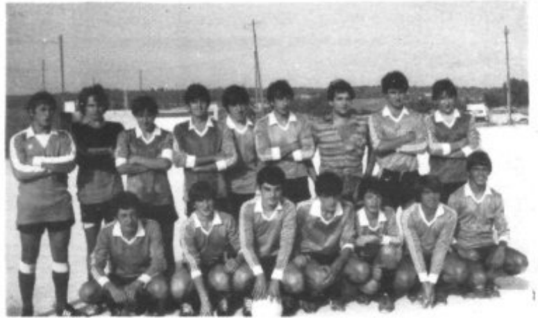
EQUIPO JUVENIL DE LA UNION DEPORTIVA PETRA