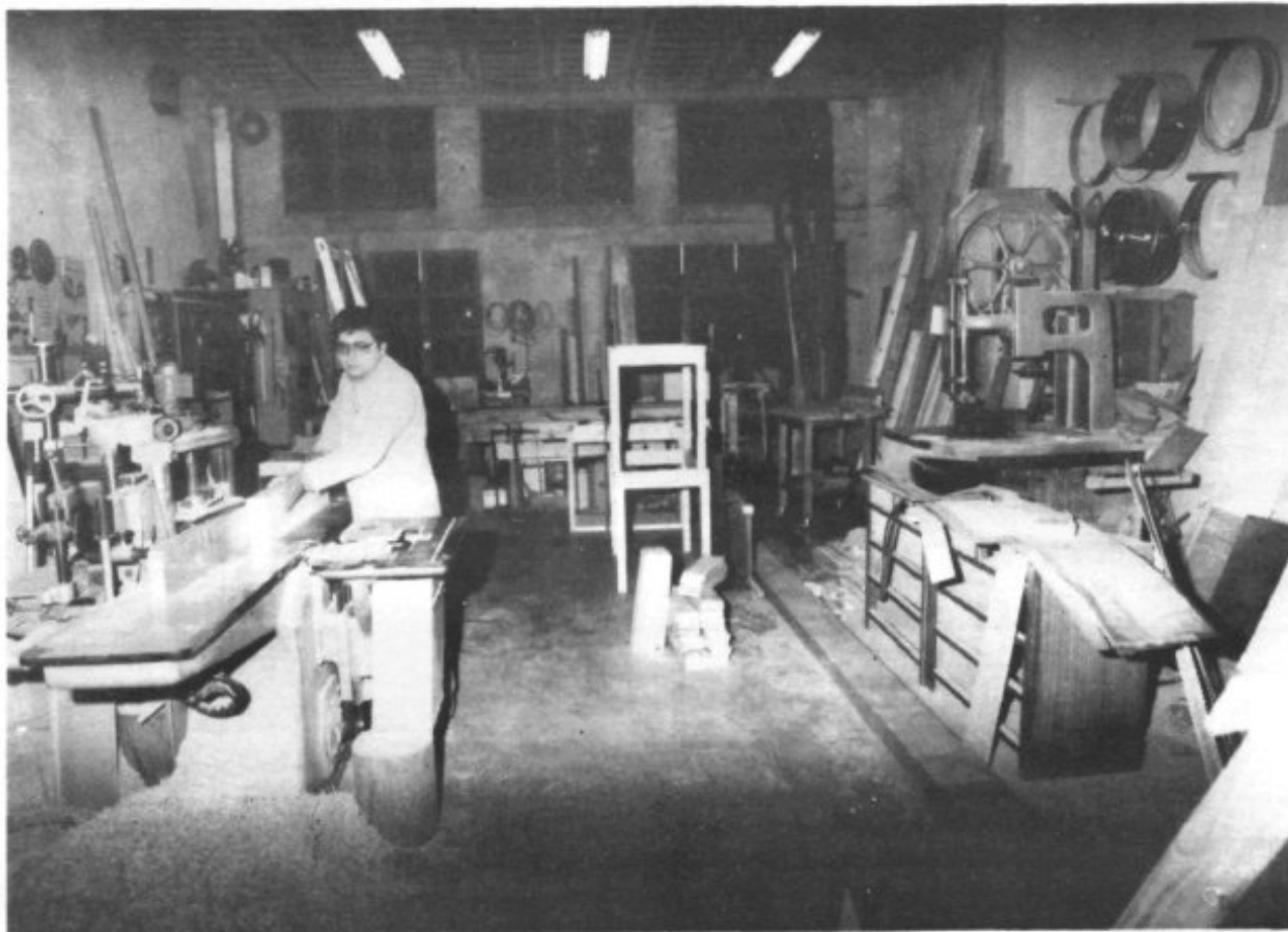
NUESTRO CARPINTERO EN PLENO TRABAJO.

A la entrada de Petra por la carretera procedente de Vilafranca la segunda calle que cruzamos llamada Torrella, travesía desde la calle Mayor hacia la del Barracar Alt, en el N° 6 está situada la carpintería objeto de este reportaje. Entramos en el nuevo y espacioso taller y allí nos encontramos con el único carpintero que trabaja en este lugar, dedicado en este preciso momento a su plena tarea. Si bien es verdad que sólo un operario es quien se mueve por la bien iluminada nave, al pasar nuestra vista por los