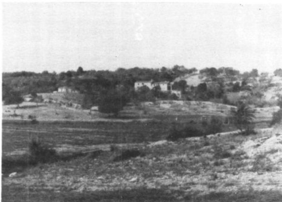
SON FLUIXÀ VISTO DESDE LA CARRETERA DE PETRA A SANT JOAN.