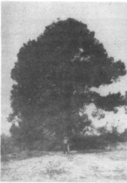
SIN DUDA ALGUNA ESTE ES UNO DE LOS PINOS MAS GRANDES DE MALLORCA. ESTA SITUADO DETRAS DE LA CASA DE SON MAIMÓ.