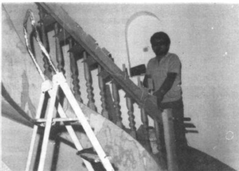
ARDUA Y DIFÍCIL FUE LA TAREA DE MONTAR LA BARANDILLA DE LA ESCALERA EN SU SITIO.