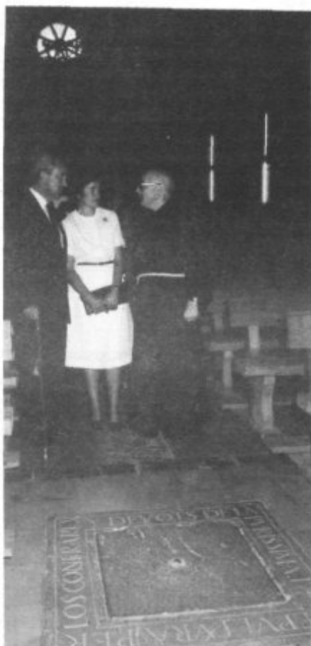
EL Sr. PRESIDENTE DE LA COMUNI- TAT AUTONOMA CON SU SENORA ANTE LA TUMBA DE LOS PADRES Y HERMANA DEL P. SERRA