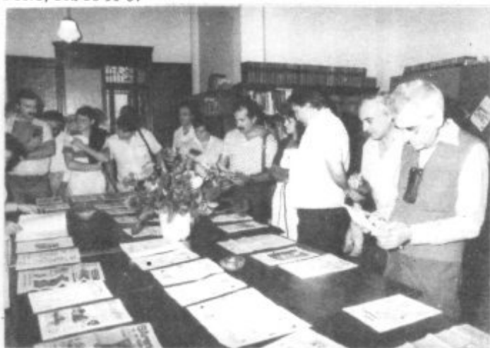
INAUGURACION DE LA EXPOSICION DE LA "PREMSA FORANA"