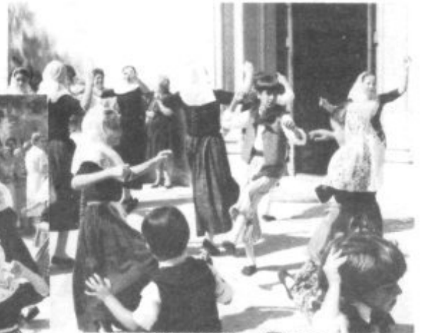
LOS PEQUENOS DIERON CIERTA GRACIA Y COLORIDO A LA VELADA.