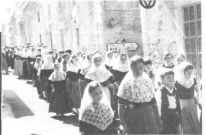
DESFILE PREVIO A LA ACTUACION EN LA PLAZA RAMON LLULL.