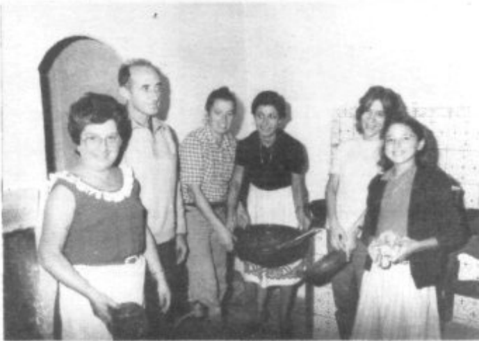
TAMBIEN LOS COCINEROS TUVIERON SU ACTUACION IMPORTANTE EN ESTA JORNADA