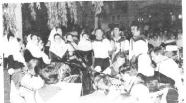
LA ORQUESTA Y CANTORES DE LA AGRUPACION FOLKLORICA

A Concursos y Trobades i a mil festes populars amb èxit i amb elegància, sovint ha participat.