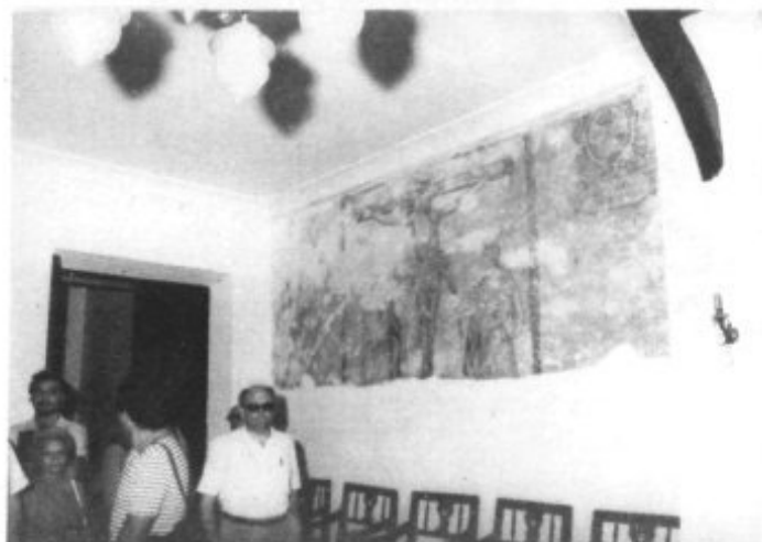
PINTURA MURAL DE 1612 EN EL SALON DE ACTOS DEL AYUNTAMIENTO CUANDO ESTE LOCAL ERA HOSPITAL