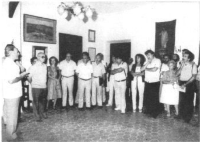
SALUDO DEL Sr. ALCALDE A LOS ASAMBLEISTAS