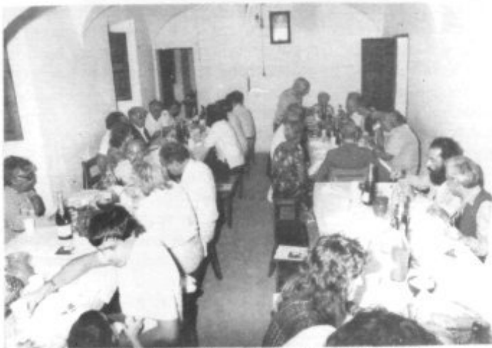
DURANTE LA COMIDA DE FRATERNIDAD

1808), i que hi ha un carrer dedicat a la seva memòria, ens sentim participants i beneficiats d'aquesta labor que ha duit aquesta revista i la gent que la fa. Com a companys d'una feina informativa a un poble de la Part Forana -i quasi veïns- sols podem tenir paraules de felicitació i agraïment cap a una publicació que ens va acollir des del número 5 fins al número 12 i que fins i tot després ens ha ajudat en distintes ocasions de manera desinteressada.