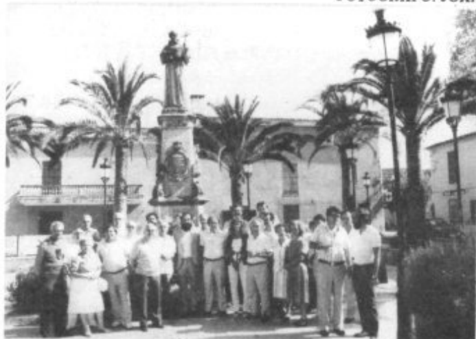
PARTICIPANTES EN LA DIADA DE LA "PREMSA FORANA"

REPORTAJE DE LA DIADA DE "PREMSA FORANA"