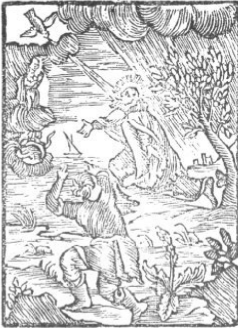
EL BTO. RAMON LLULL