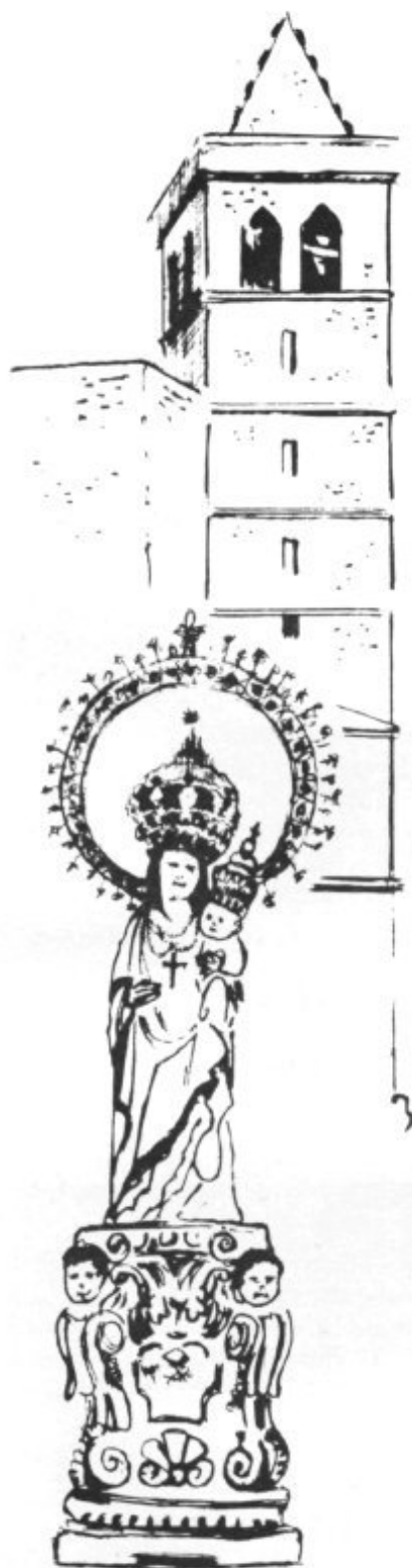
LA VIRGEN DE LA SALUD SOBRE LA PARROQUIA DE SAN MIGUEL