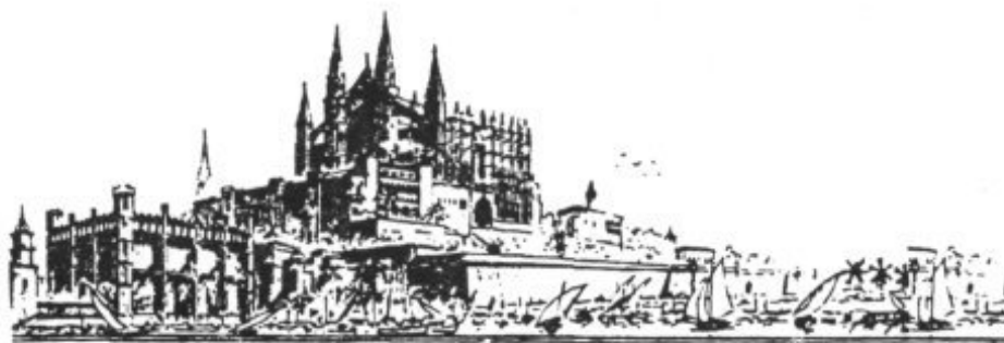
LA CATEDRAL DE PALMA DE MALLORCA