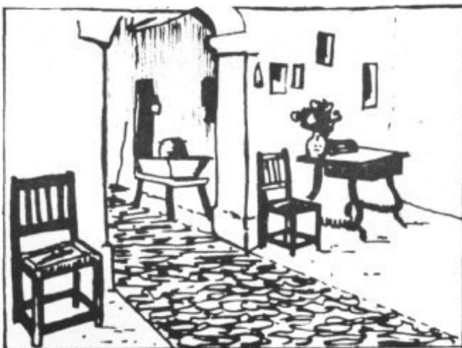
ENTRADA DE LA CASA DEL P. SERRA

La antigua casa de arenisca y adobe y su