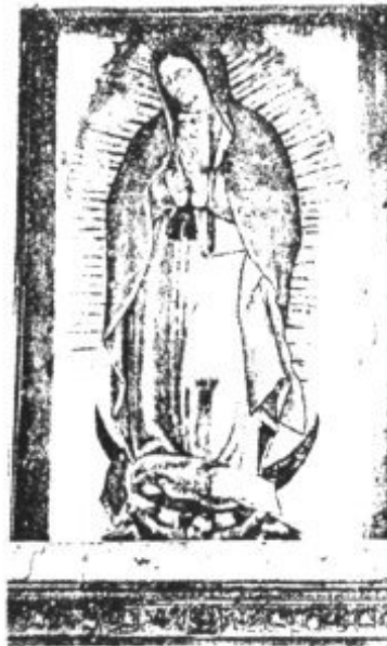
Ntra. Sra. DE GUADALUPE (MEJICO)

A diferencia de la Reina y Señora del cerro del Tepeyac, nuestra virgen alabastrina habría cruzado, y en momentos de tormenta, el Mar Mediterráneo. Nuestra Virgen de la Salud habría venido al frente de las aguerridas huestes del valeroso monarca aragonés, Jaime I, "sujeta a la popa de algún buque, como se desprende de una muy marcada hendidura practicada en su parte posterior". Quiere la tradición que tal honor hubiese cabido, natural por otra parte, a la galera