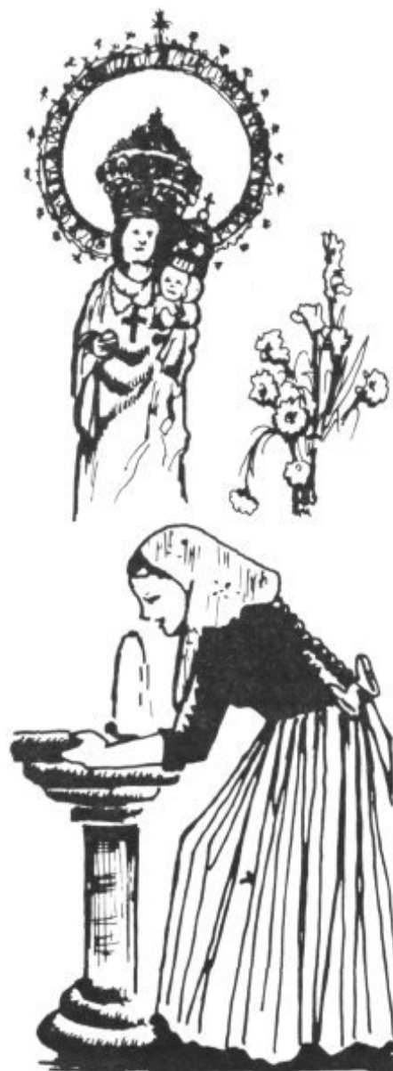
LA FUENTE DE LA SALUD

En el mismo documento se enumeran algunos de estos hechos prodigiosos.