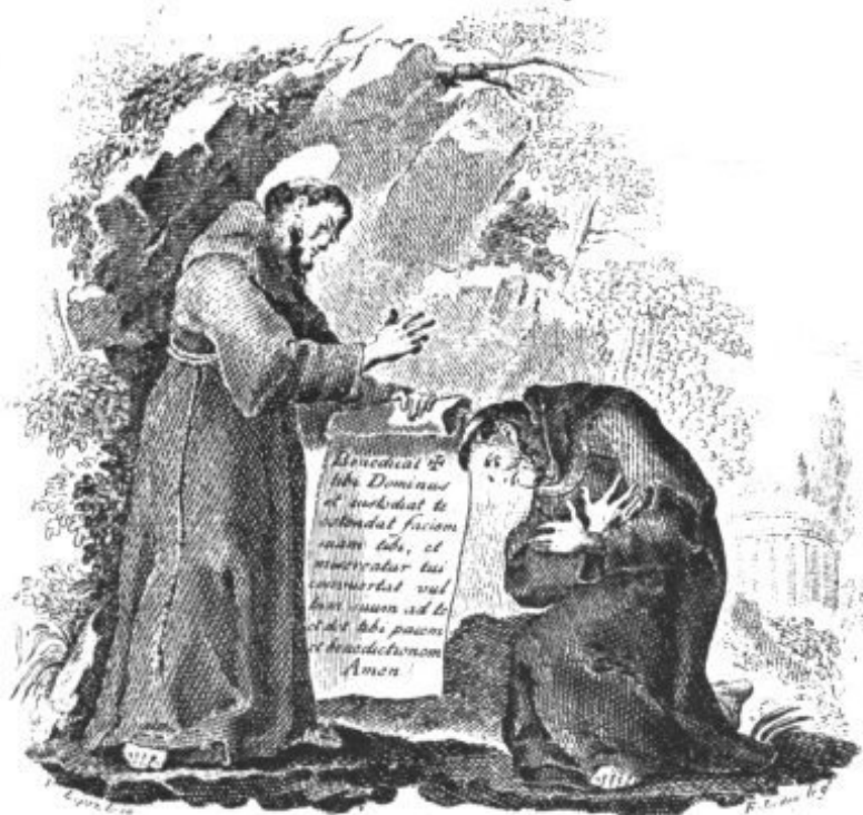
BENDICION DE S. FRANCISCO DE ASSIS.

- Fray Junípero Serra (1713-1784), creador de las nueve primeras misiones de la Alta California, origen de ciudades como San Diego, Monterey, San Francisco y de otras encantadoras