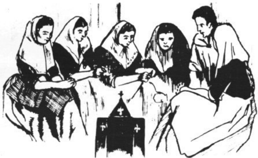
GRUPO DE PIADOSAS VECINAS REZANDO EL ROSARIO ANTE LA CAPELLETA

-Sí: posau-lo damunt aquesta altar, que bona companyia nos farà, i nos deixarà passar una bona nit.