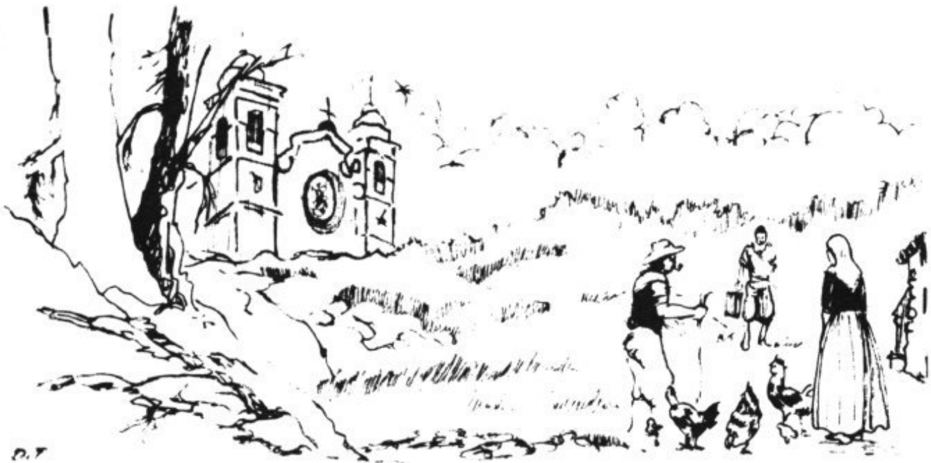
CAMINO DEL SANTUARIO PARA DEVOLVER LA "CAPELLETA"