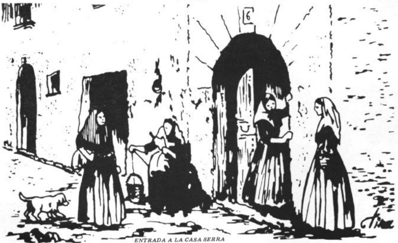
ENTRADA A LA CASA SERRA