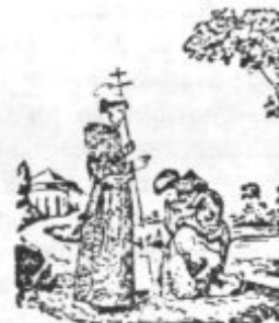
BENDICION DE SAN FRANCISCO DE ASIS

El Señor te bendiga y te guarde. Te muestre su rostro y tenga misericordia de tí. Te mire benignamente y te conceda la paz. El Señor bendiga a este su siervo.