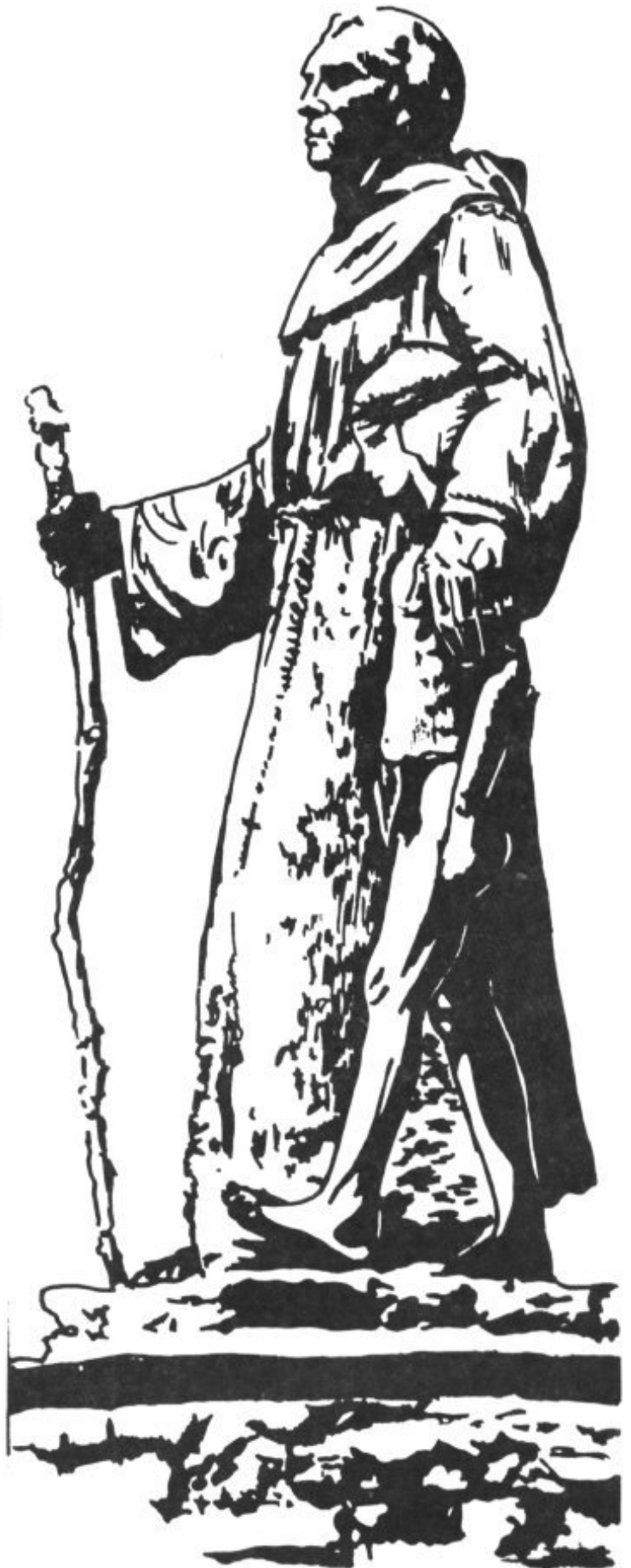
MONUMENT A FRA JUNIPER SERRA EN LA MISSION DE SANT FERNANDO