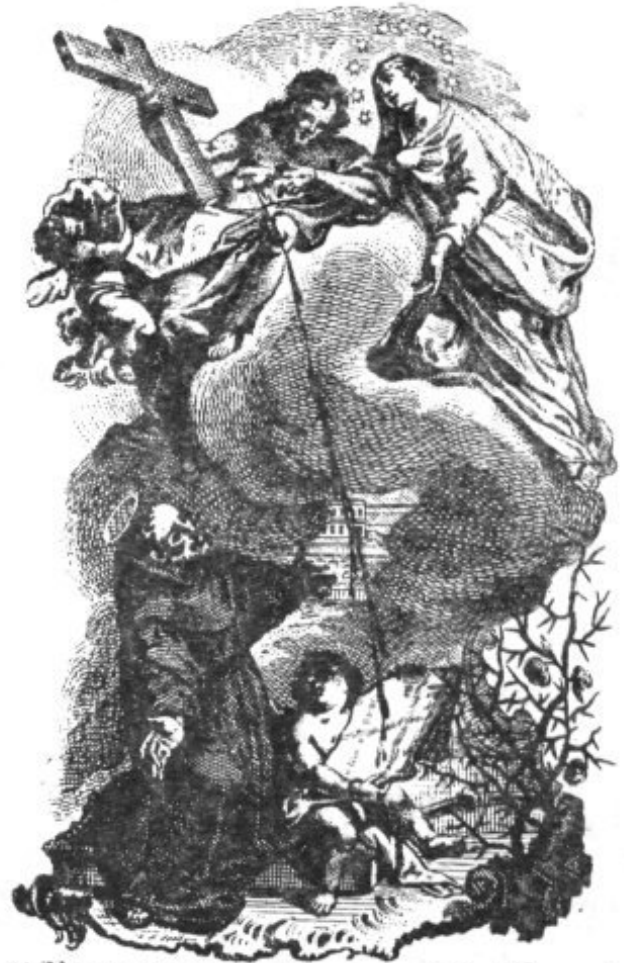
S. FRANCISCUS Fundator Ord. Seraph .

PORTADA: La acreditada banda de música de Alfafara (Alicante), que tanto animó las pasadas fiestas de Ntra. Sra. de los Angeles del Convento San Bernardino de de Sena, de Petra.