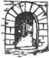
Nacido en Petra (Mallorca) 1713

tlana tradicional. Fue la fuerza que dotó a Frau Junípero del reconocimiento de su verdadera misión terrena.