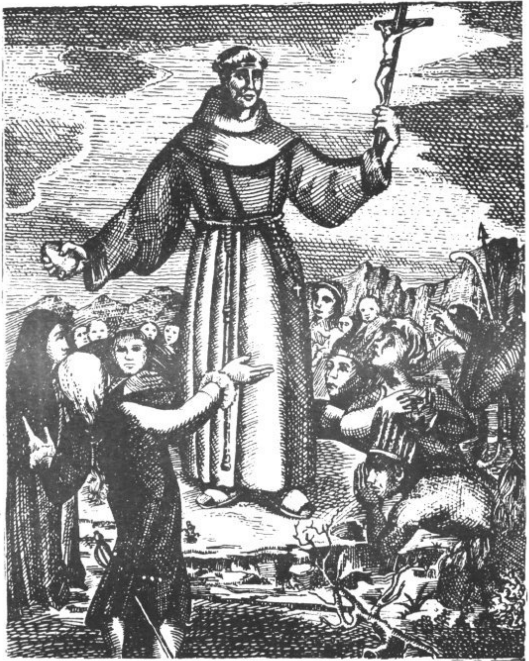
Grabado del siglo XVIII