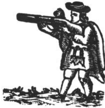
ESCOPIERO DE CHISPA

A 16 de febrer (1643) fonch enterrat lo cos de jo. soler en lo convent de St. domin-