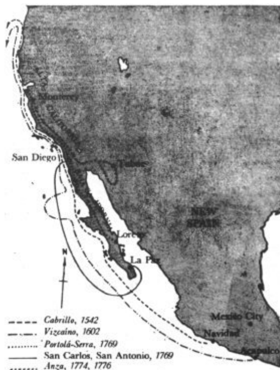
Las principales expediciones a la Alta California

2 valeros, 6 sacatrampas, un saco de piedras de fusil.