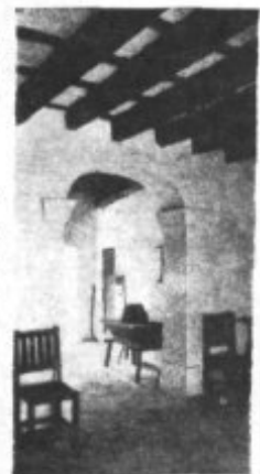
Casa Junípero Serra

Usted será cordialmente recibido en la Casa Solariega y Museo del P. Serra de 10:30 a 1:30 y de 15 a 19 hrs. Visite igualmente la Iglesia Parroquial donde fue bautizado, el Convento San Bernardino donde aprendió las primeras letras y su plaza con el monumento.