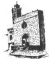
Convento San Bernardino

VISITE PÉTRA (ESPAÑA) CUNA DE FRAY JUNIPERO SERRA