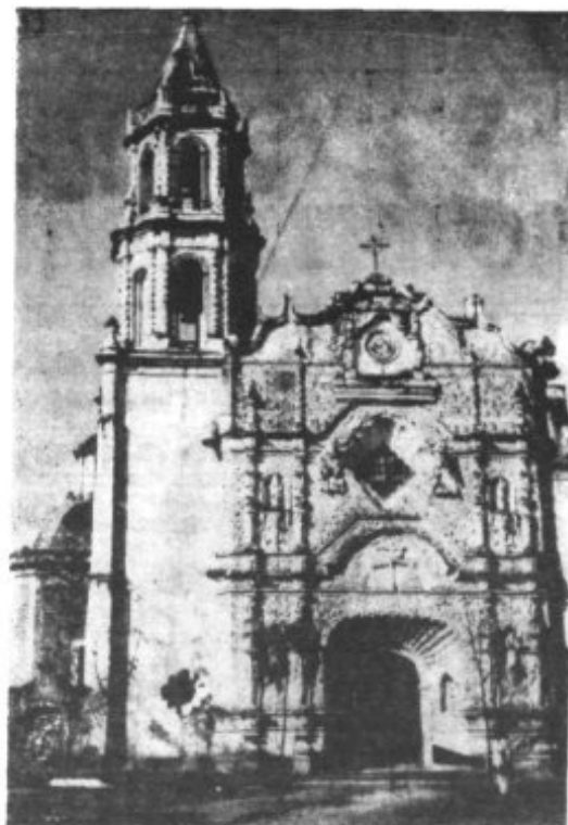
Iglesia de la Misión de Santiago de Jalpán. E. P. Serra encontró una pequeña iglesia de adobes, pero edificó este hermoso templo. Es la única construcción suya que todavía existe.